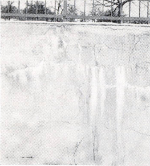
Abb. 2 Kalkausblühungen auf einer verputzten Betonstützmauer (Kalktränen längs der Putzrisse).