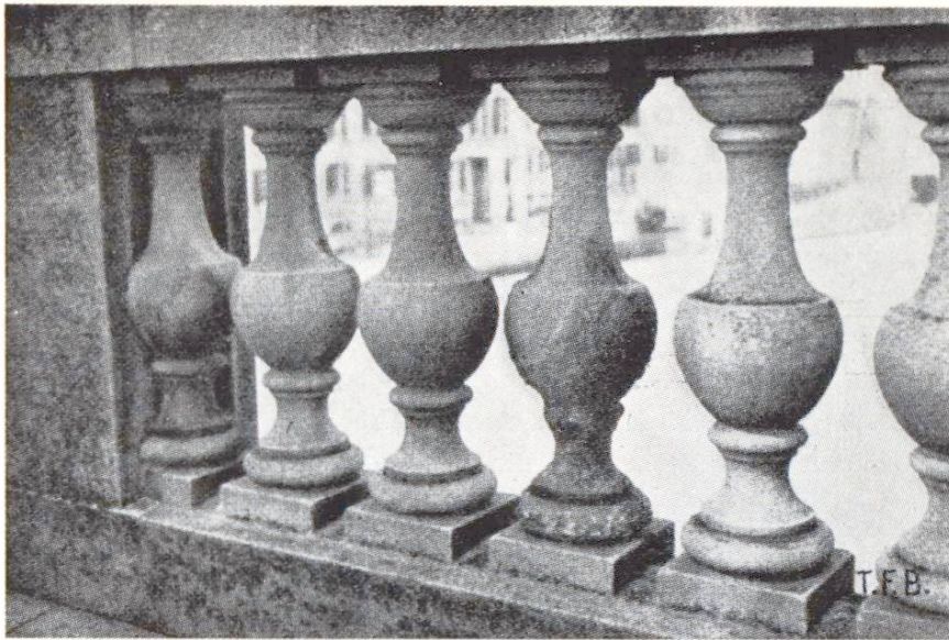
Abb. 6 Wirkung von Salzanreicherungen (verbunden mit Gipskrusten) an Kunststein. Die Balustrade zeigt stellenweise starke Lockerungen und Abblätterungen

kann nicht den meteorologischen Daten der betreffenden Örtlichkeit entnommen werden; die 0^{\circ} -Unterschreitung ist an besonnten Objekten viel häufiger, an schattigen für den Stein geringer als die meteorologischen Tagesmessungen angeben. Frost wirkt am intensivsten auf Gesteinspartien (oder Bauteile) im Grundfeuchtebereich ein, ferner auf solche, die oft von Schneeschmelzwasser (starke Besonnung in Perioden tiefer Lufttemperaturen) durchtränkt werden.