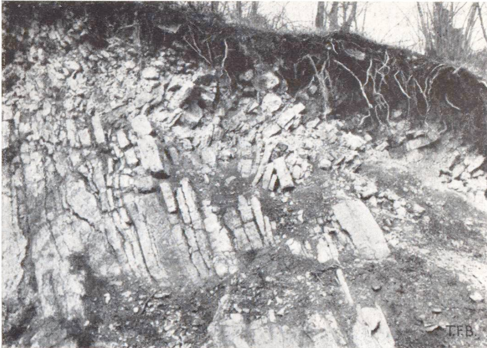
Abb. 2 Zerfall der Kalksteinschichten an der Oberfläche in einzelne Trümmer (durch Frost), die am Hang ins Rutschen kommen. Jura bei Brugg

a) Temperaturschwankungen des Steines, in erster Linie durch Wechsel von Besonnung und nächtlicher Ausstrahlung erzeugt. Die durch Wärmewechsel verursachte Ausdehnung und Schrumpfung der Gesteinsbestandteile erzeugt Spannungen und damit allmählich Rissbildungen und Lockerungen, bisweilen auch ein Ablösen der äussersten Gesteinspartie in Schalenform. Ein physikalischer Zerfall durch Wärmewechsel ist, abgesehen von Brandeinwirkungen, praktisch wichtig vor allem in Wüstengebieten mit den enormen täglichen Temperaturschwankungen, hier die bekannten Wüstenverwitterungsformen erzeugend.