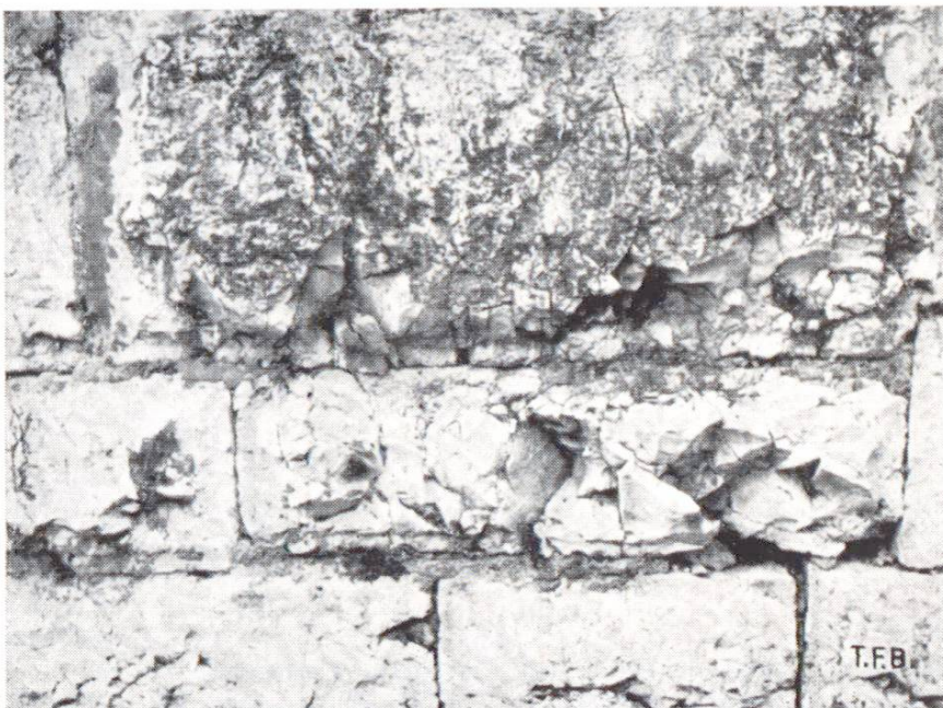
Abb. 3 Frostzerbröckelung von rissigen Kalksteinen am Bauwerk

a) Temperaturschwankungen des Steines, in erster Linie durch Wechsel von Besonnung und nächtlicher Ausstrahlung erzeugt. Die durch Wärmewechsel verursachte Ausdehnung und Schrumpfung der Gesteinsbestandteile erzeugt Spannungen und damit allmählich Rissbildungen und Lockerungen, bisweilen auch ein Ablösen der äussersten Gesteinspartie in Schalenform. Ein physikalischer Zerfall durch Wärmewechsel ist, abgesehen von Brandeinwirkungen, praktisch wichtig vor allem in Wüstengebieten mit den enormen täglichen Temperaturschwankungen, hier die bekannten Wüstenverwitterungsformen erzeugend.