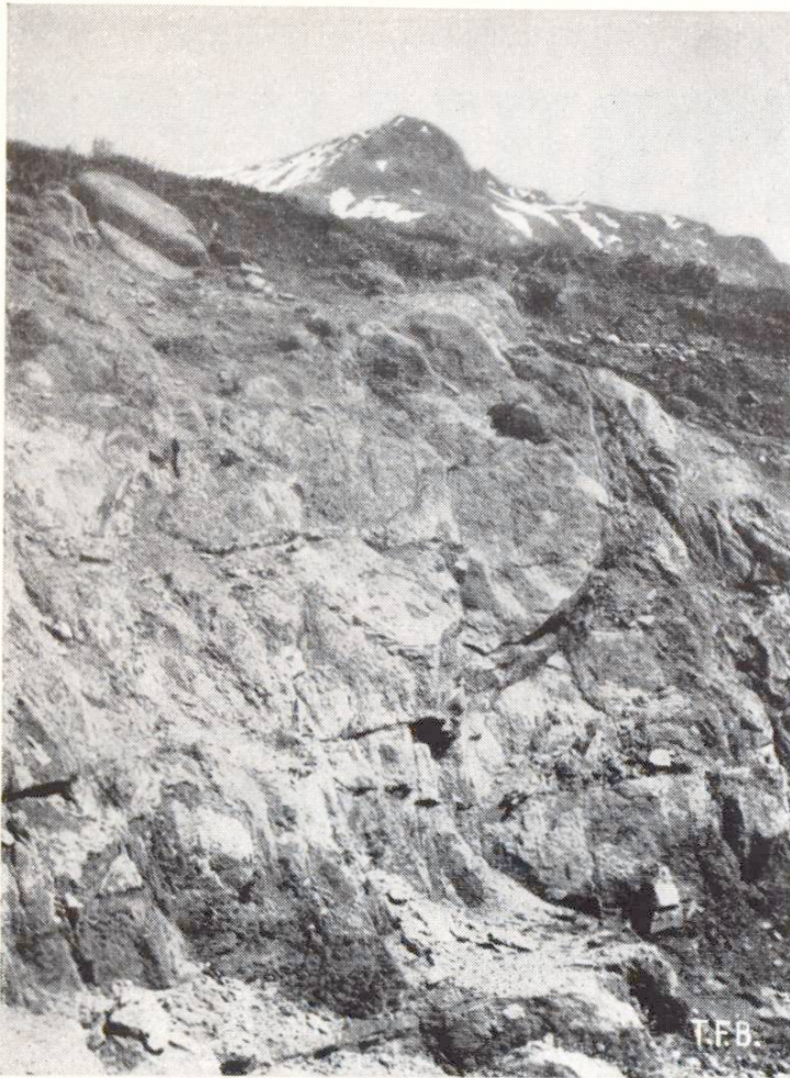
Abb.1 Im Hochgebirge zeigen die kristallinen Gesteine (Gneise) nur relativ selten eine ausgesprochene tiefreichende Lockerung durch Verwitterung. Gotthardgebiet

ganz allmählich solche Tonmineralien. Dadurch werden die Gesteine aufgelockert, die Wasserzirkulation erhöht sich, die Umwandlung wird beschleunigt, zugleich tritt auch ein physikalischer Zerfall ein. Schliesslich bleibt entweder eine ganz lockere Masse übrig, ein kaolinisierter Granit, oder aber das Gestein wird durch Ausschwemmung der Tonmineralien ganz zerstört, unter getrennter Wiederablagerung der Tonmineralien als Tonlager des nicht zerstörbaren Quarzanteils des Granites als Sand.