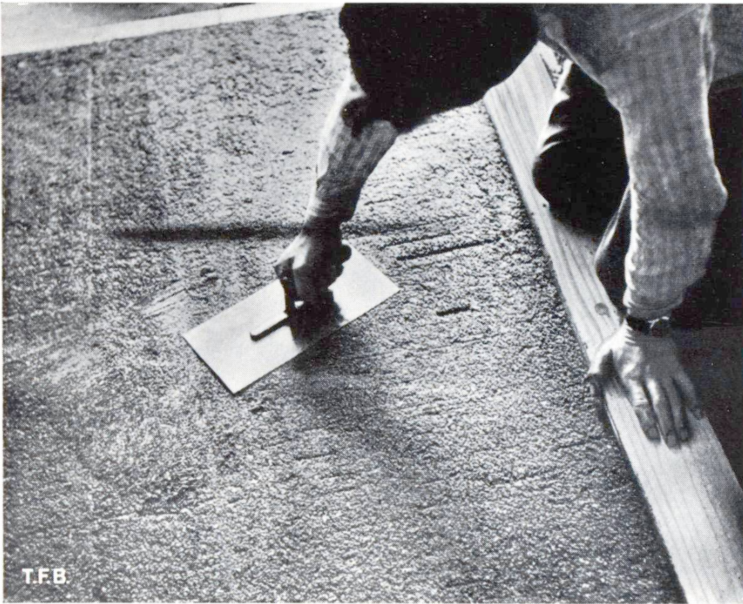
Abb. 4 Abglätten des Ueberzugs mit der Stahlscheibe

mässige Erwärmung zu vermeiden. Wenn die Gefahr einer vorzeitigen Austrocknung (vor dem Abbinden) besteht, ist der Belag durch feuchte Säcke od. dgl. zu schützen und in jedem Fall das eigentliche Abbinden des Cements zu ermöglichen.