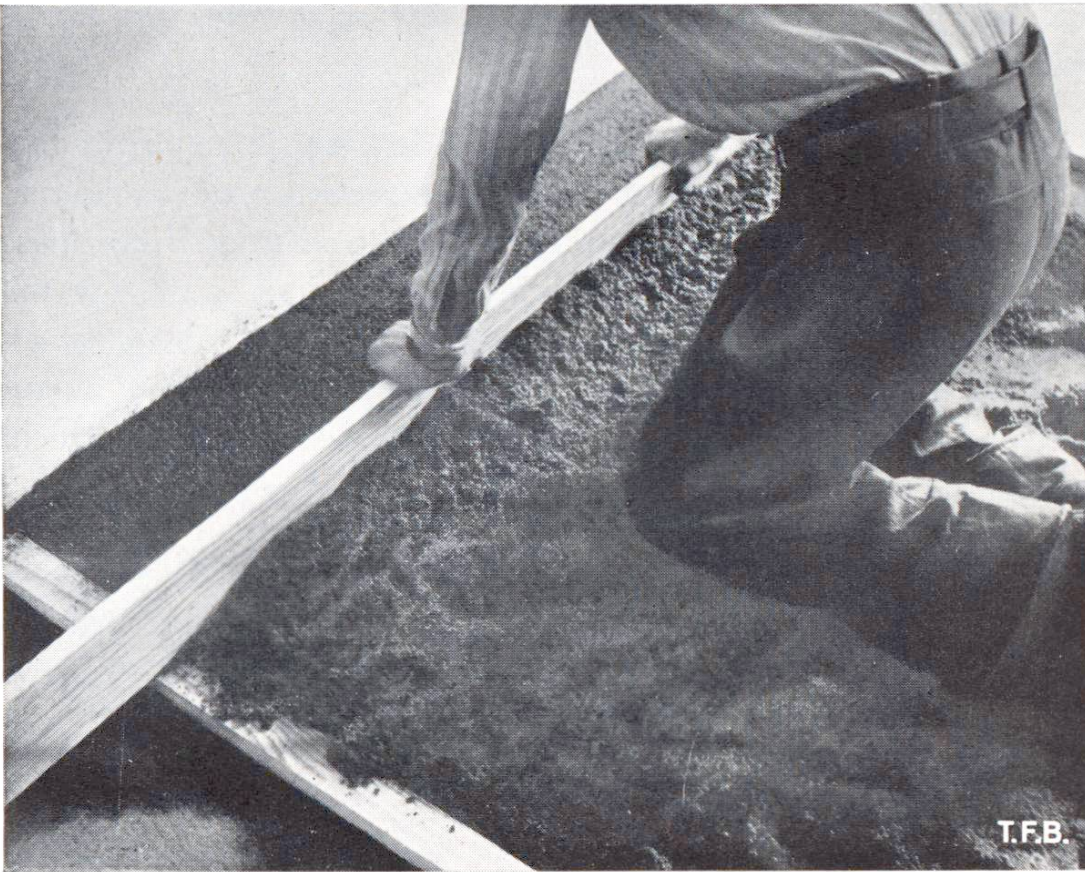
Abb. 2 Abziehen und Verdichten des verteilten Mörtels mit der Latte

beseitigen und die letztere bei zu grosser Glätte aufzurauen. Am günstigsten für die Haftung ist es natürlich, wenn frisch auf frisch gearbeitet, also die Unterlagsschicht direkt auf den frischen, noch nicht erhärteten Beton aufgetragen wird. Der Überzugsmörtel ist dann homogen und ohne die Gefahr des Hohlwerdens mit dem Unterbeton verbunden .