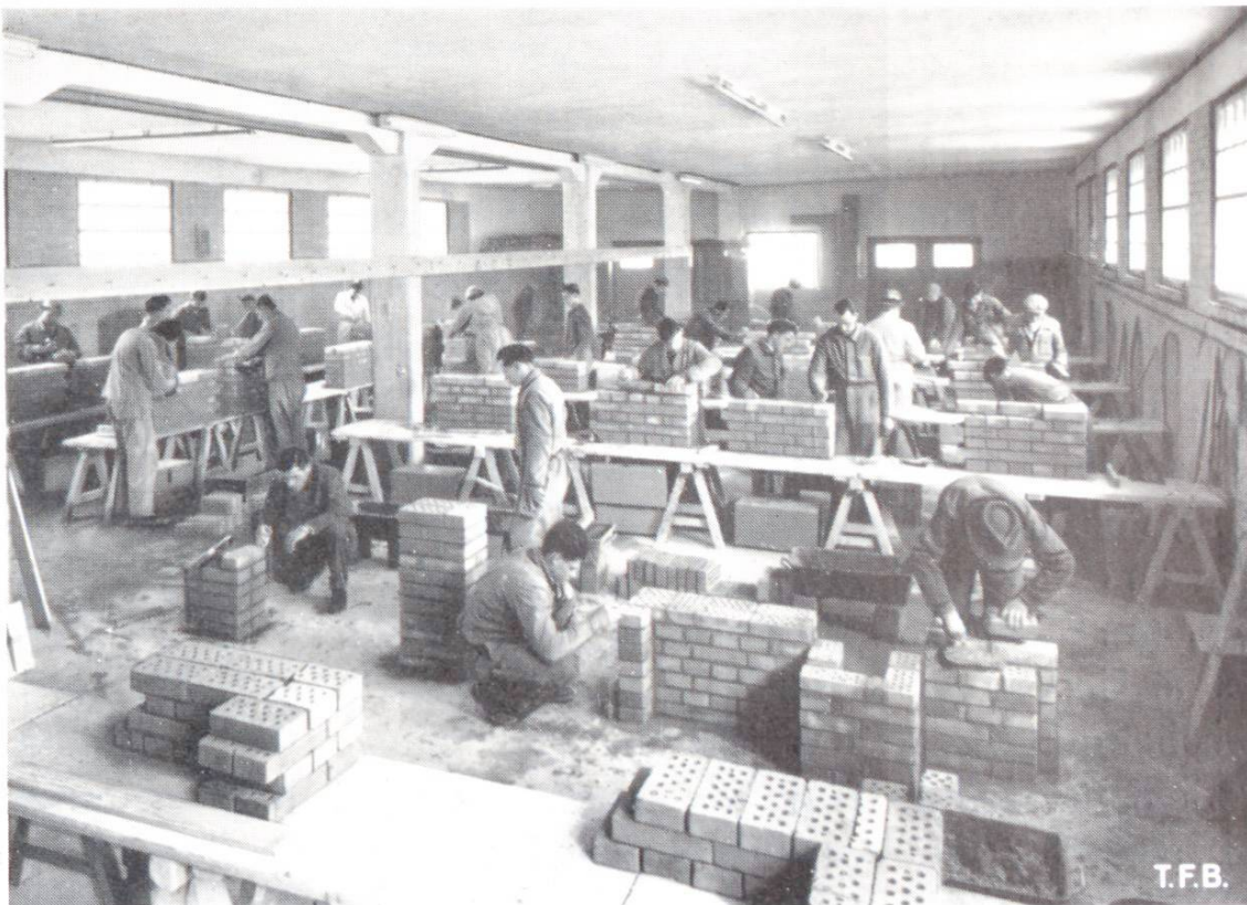
Abb. 3 Innenaufnahme der Lehrhalle Sursee des Schweizerischen Baumeisterverbandes

Die Maurerlehrgänge übernehmen aber noch Aufgaben aus der Berufskunde, die in den Bereich der Gewerbeschulen gehören