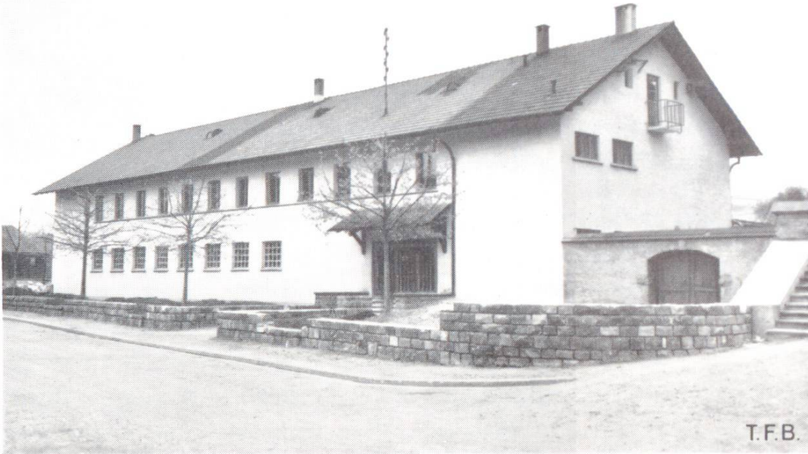
Abb. 2 Lehrhalle Sursee des Schweizerischen Baumeisterverbandes

kantone, aus welchen sich ein grosser Teil des beruflichen Nachwuchses rekrutiert und die Arbeitsmöglichkeiten stark saisonbedingt sind.