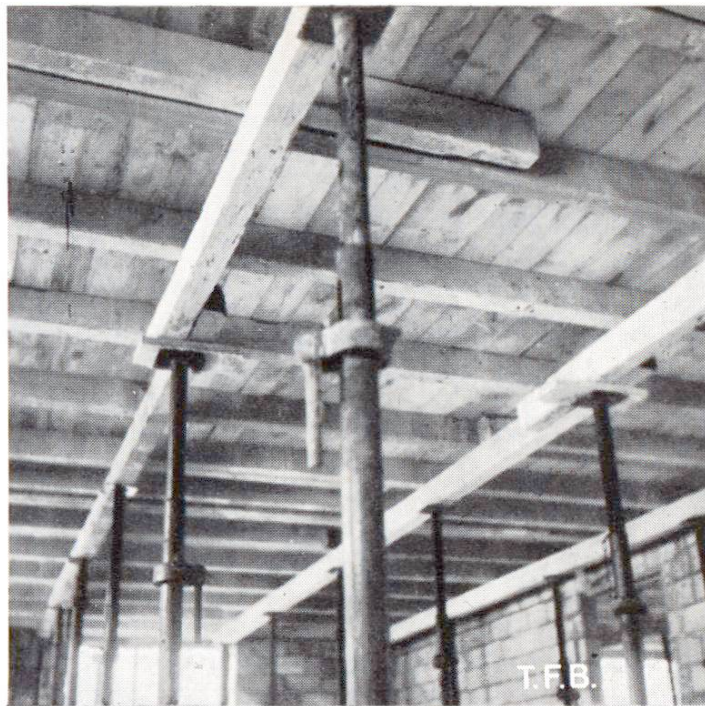
Abb. 3 Normal geschalte Decke mit Schalläden, Kanthölzern und Patentstützen

einfach durch Verschwenken mit Brettern ausgeführt werden. Werden zur Spriessung eiserne Patentstützen verwendet, die durch den raschen Einbau und die vielfache Verwendung durch Verstellen der Höhe, sich grosser Beliebtheit erfreuen, so sind die horizontalen Kräfte durch speziell angeordnete Verbände aufzunehmen. Im Hochbau erübrigen sich vielfach diese speziellen Vorkehrungen, wenn genügend starke Mauern die Schubkräfte aufnehmen.