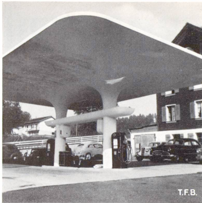
Abb. 1 Pilzköpfe mit kontinuierlichem Übergang, geschalt mit angepasster Gerüstung, Kleinholz und Gips