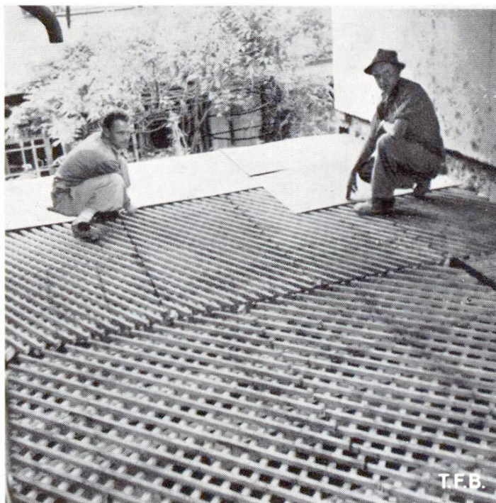
Abb. 2 Schaltafeln auf Gitterrost

Zu einer guten Schalung gehört natürlich eine einwandfreie, starke Spriessung. Die Spriessung muss so tragfähig sein (darauf ist vor allem auch im Hochbau zu achten), dass sie in der Lage ist, weitere Schalungen und Decken zu übernehmen, die, bevor die Erstbetonierte tragfähig wird, schon aufgebracht werden (Abb. 3). Es ist immer zu bedenken, dass die Spriessung auch andere als vertikale Lasten zu übernehmen hat. Deshalb muss sie räumlich ausgesteift werden. Die horizontalen Kräfte infolge Winddruck, schiefer Schalungen oder gar ungeschickter Manipulationen mit schweren Maschinen sind ja nicht zu unterschätzen. Bei einer hölzernen Spriessung kann eine Sicherung sehr