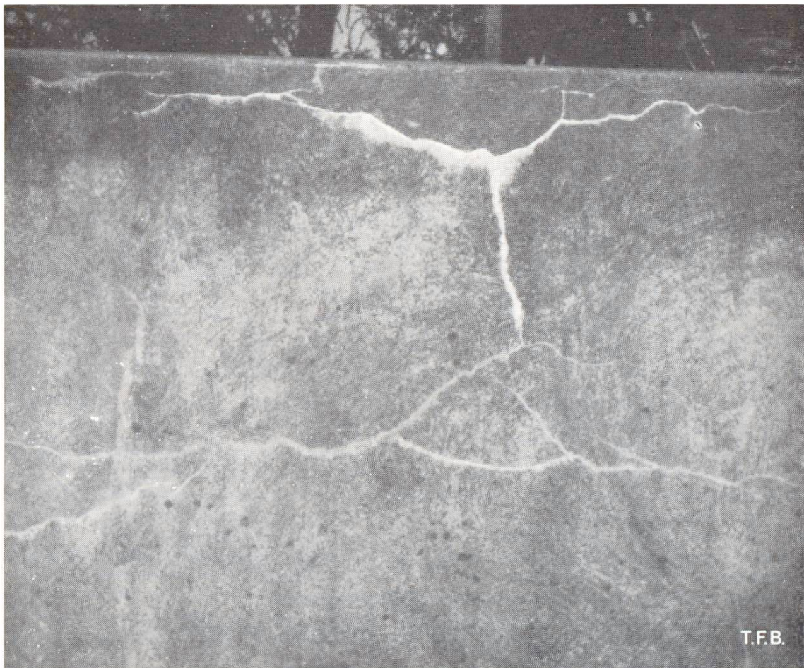
Abb. 2 Diese Risse in einer Stützmauer sind vollständig zugewachsen. Im oberen Abschnitt, wo offenbar ein stärkerer Wasserdurchsatz stattfand, kam es stellenweise auch zu äusseren Kalk-Ausscheidungen

Eine für die Praxis viel wichtigere Folge der möglichen Selbst-