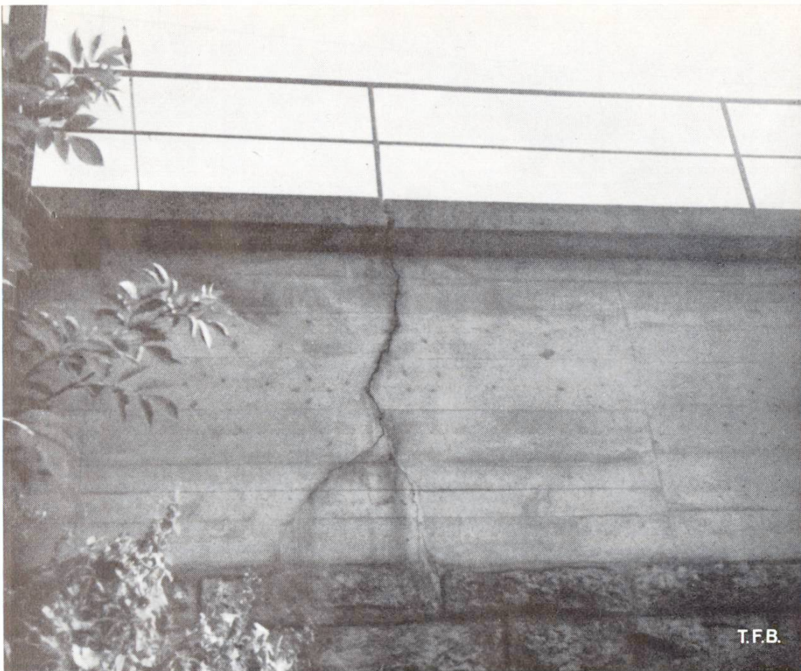
Abb. 4 Bei einer Rissweite, wie sie dieser klaffende Setzungsriss im erhöhenden Aufbau einer Brücke aufweist, kann naturgemäss eine Selbstheilung nicht mehr erwartet werden

stens in jungem Beton auf und sind deshalb zur Selbstheilung geeignet. Weniger gut ist es mit der hierzu notwendigen Feuchtigkeit bestellt. Der günstige Zustand, bei dem der Hohlraum des Risses mit Wasser gefüllt bleibt, ist nur in seltenen Fällen gegeben. Der Feuchtigkeitsgehalt kann alle Abstufungen haben und auch sehr veränderlich sein. Die Auswirkung davon ist, dass die Selbstheilung eben kürzere oder längere Zeit beansprucht und bei vollständiger Trockenheit überhaupt nicht eintreten kann. Wesentlich für ihre Dauer ist naturgemäss auch die Rissweite.