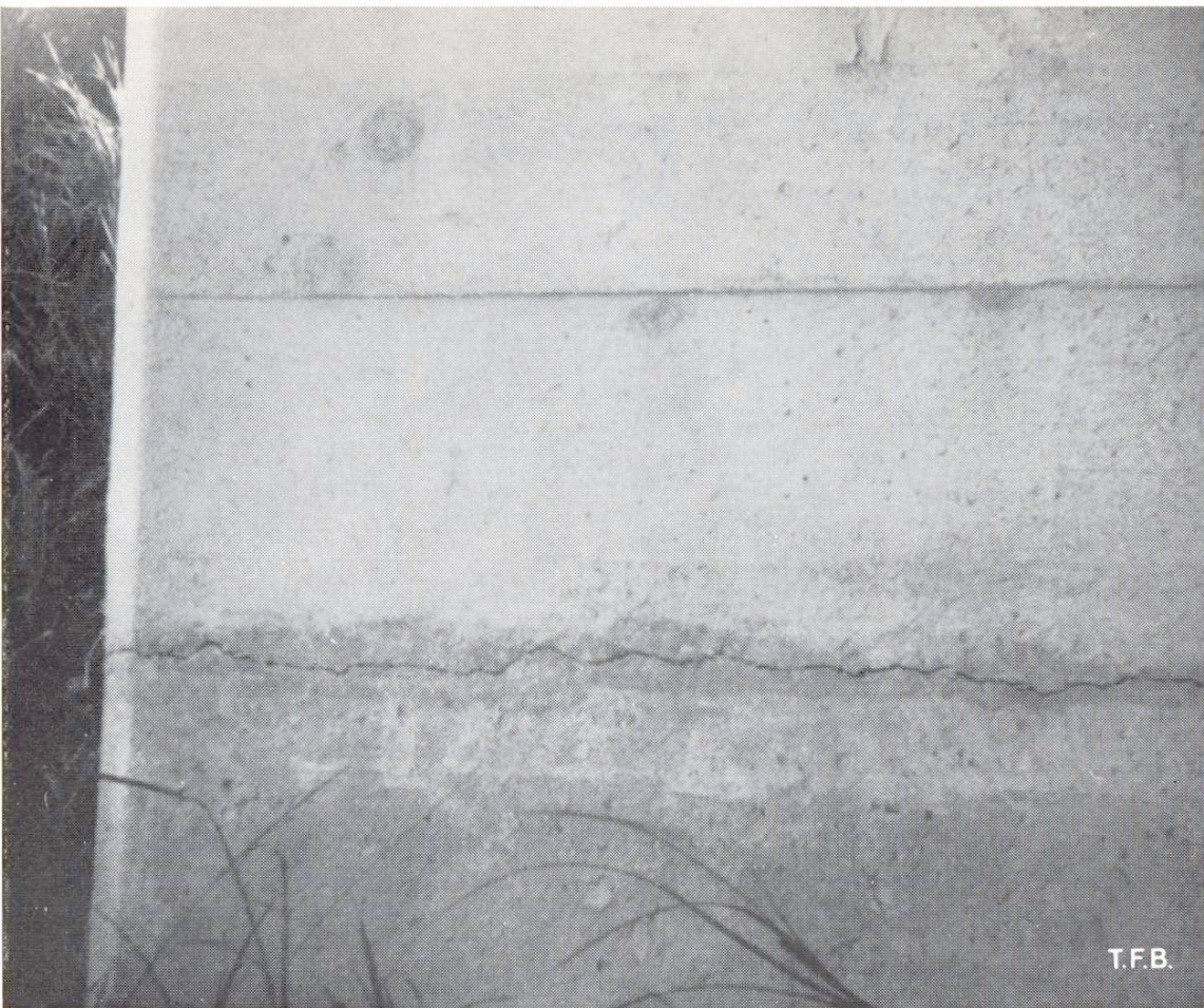
Abb. 3 Starker Setzungsrisse eines Pfeilers entlang der Arbeitsfuge. Hier zeigen sich Ansätze einer allerdings sehr langsam fortschreitenden Selbstheilung infolge der aufsteigenden Erdfeuchtigkeit

heilung ist aber darin zu erblicken, dass hierdurch entstandene Risse abgedichtet werden. Diesem Umstand ist es gewiss in vielen Fällen zu verdanken, wenn eine drohende Korrosion der Armierungseisen nicht eingetreten ist. Wo Luft und Feuchtigkeit, die Voraussetzungen zum Rosten, durch den Beton zudringen, kann auch bestimmt mit einer Selbstheilung gerechnet werden. Ferner setzt die Selbstheilung der Entwicklung von einsetzenden Ausblühungen meistens bald ein Ende und sie vermindert auch in vielen Fällen die Gefahr von Frostsprengungen.