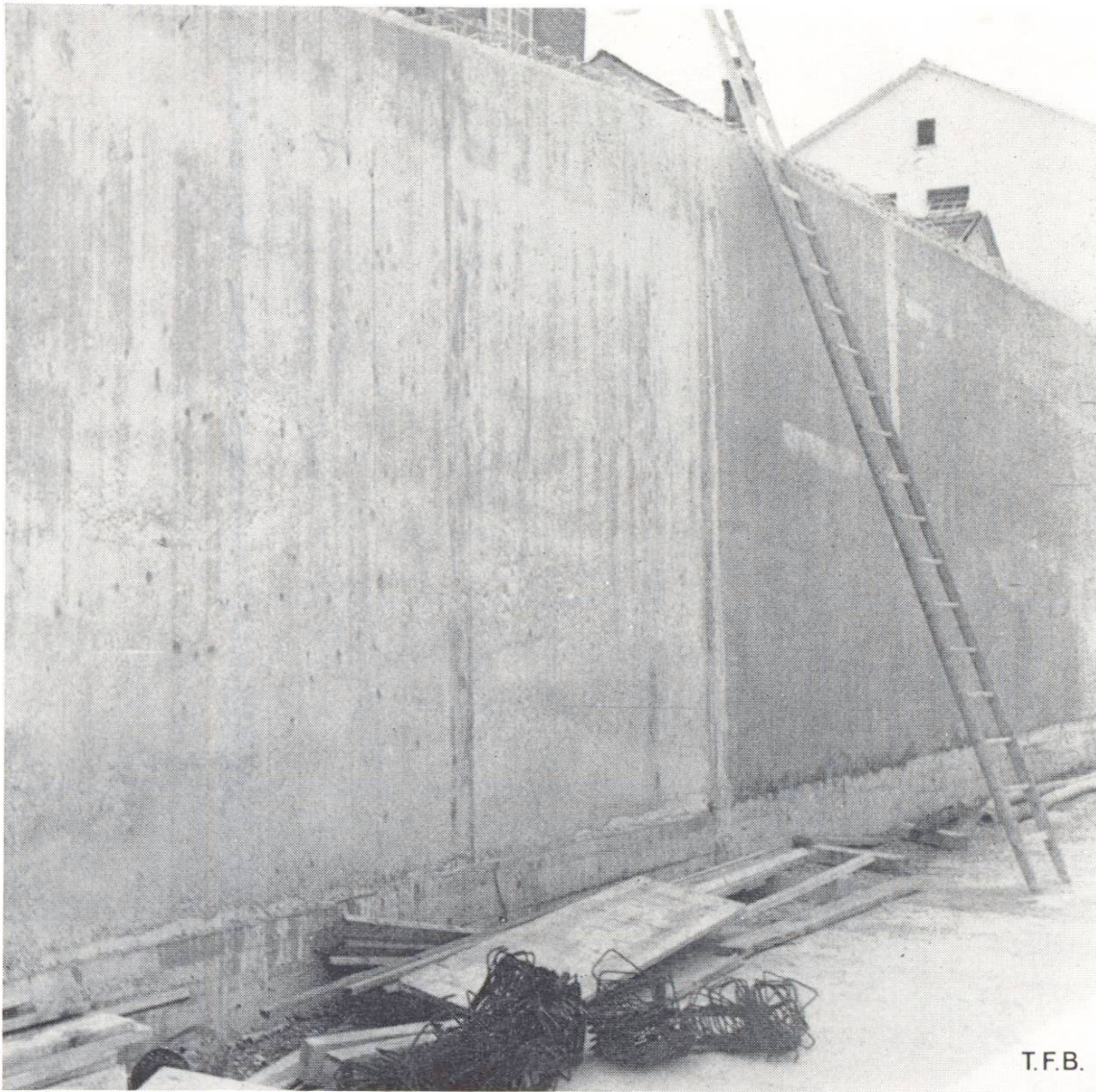
Abb. 2 Unterschiedliche Grautönung des Betons vertikal und horizontal begrenzt infolge kleiner Unregelmässigkeiten des Wasserzementwertes.

ders anfällig sind, oben sehr dünn auslaufen zu lassen. Dies ist zu vermeiden.