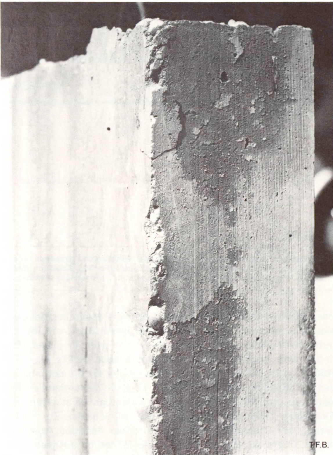
Abb. 1 Nahaufnahme einer typischen Zementhautablösung. Das Schalungsbrett der Stirnseite wurde durch die quellenden Bretter der Frontseite frühzeitig weggedrückt. Man beachte auch die aus diesem Grunde beschädigte Kante. Schematische Darstellung des Vorganges s. Abb. 2