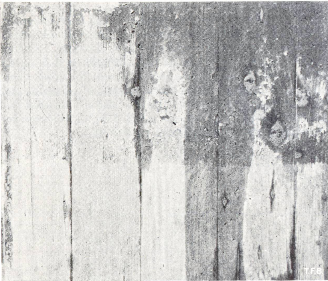
Abb. 4 Zementhautablösung infolge «Schüsseln» der Schalungsbretter (3. und 4. Brett von links, schematische Darstellung des Vorganges: Abb. 2, Mitte). Im oberen Teil erkennt man Zementhautablösung als Folge einer geringen Verschiebung gegenüber der Schalungsfläche wegen sich setzendem Beton (unstabile Schalung)

die Gefahr oft nicht vorauszusehen, und wirksame Gegenmassnahmen sind schwierig zu treffen oder kaum bekannt.