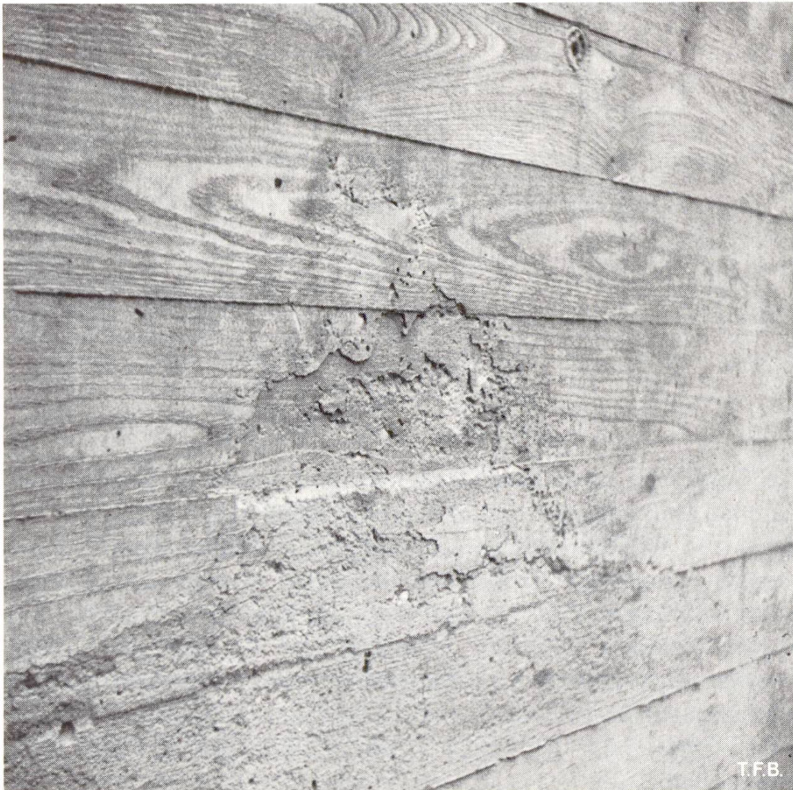
Abb. 5 Massive Zementhautablösung durch Wegdrücken der Schalung beim Einbringen und Verdichten der überliegenden Schicht (unstable Schalung, evtl. untere Schicht schlecht verdichtet).

6 Ursachen zu solchen reibenden Bewegungen gibt es mehr als genug. Es sind dies fehlerhafter Vibratoreinsatz, Erschütterungen beim Einbringen nachfolgender Schichten, Setzungen des Betons unter Druck oder bei nachgebender oder undichter Schalung, Quellen des Schalungsholzes u.a. Man vermeidet die Schädigung insbesondere mit stabiler und dichter Schalung und mit sorgfältiger und geplanter Betonierarbeit. Wichtig ist beispielsweise, das Einbringen so zu regeln, dass der zeitliche Abstand von Schicht zu Schicht nicht zu gross wird und die Nachvibration der vorgängigen Schicht noch mühelos möglich ist.