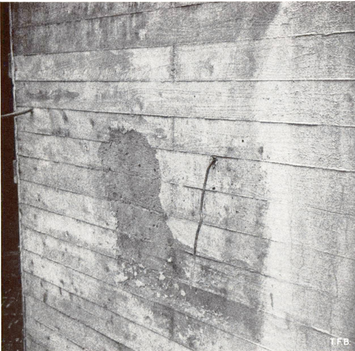
Abb. 6 Starke Zementhautablösung infolge Vibratorwirkung in einer schon zu stark verfestigten Schicht.