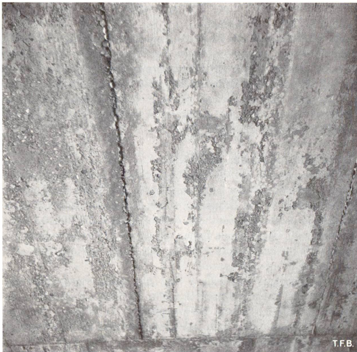
Abb. 7 Starke Zementhautablösung an der Untersicht einer Decke infolge Schwächung des Zementsteins bei Wasseranreicherung (Entmischung zwischen Zement und Wasser an der Schalungsfläche).