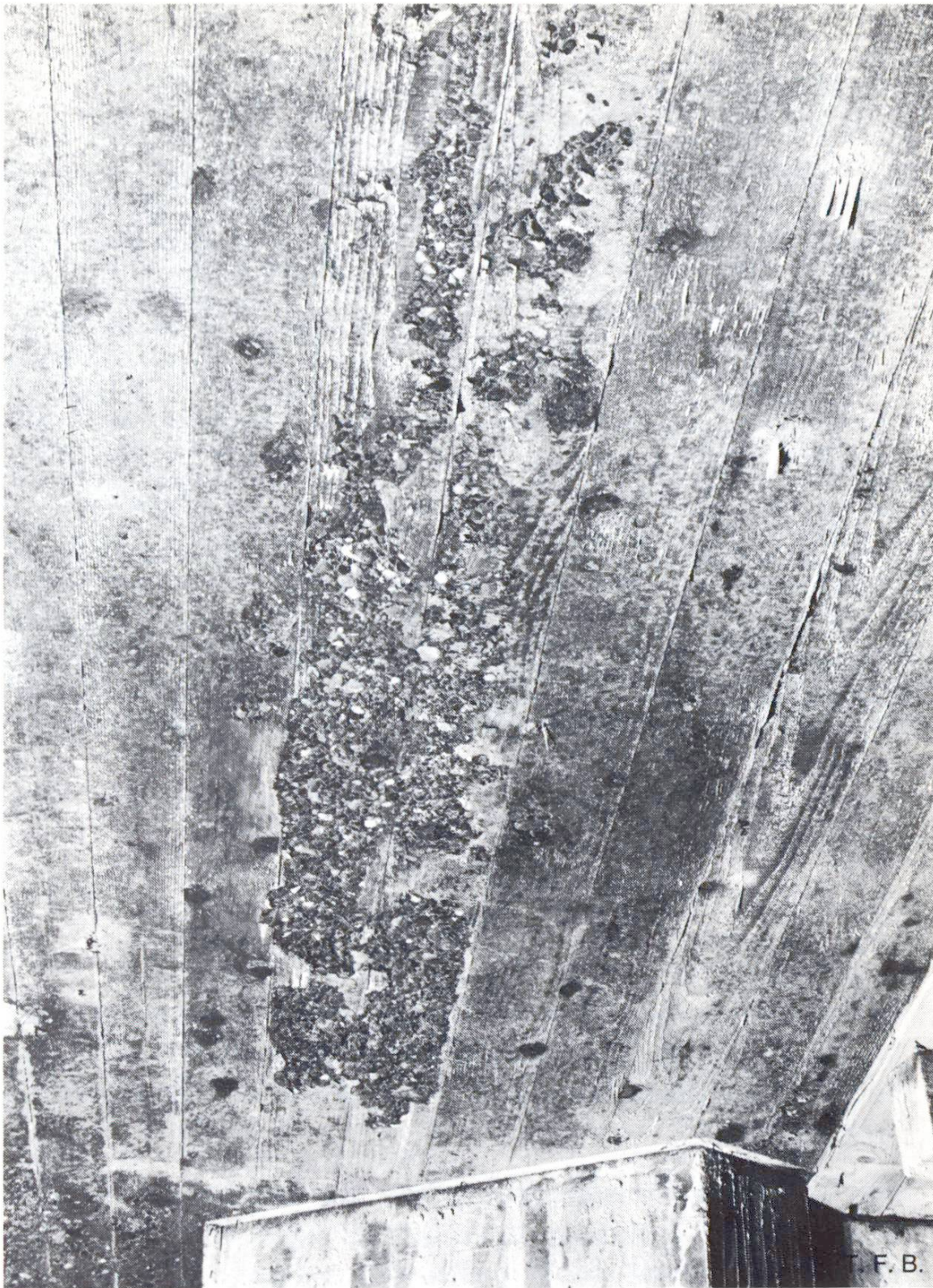
Abb. 5 Verdünnung des Betons durch Wasserpfüßen und nachfolgende zusätzliche Entmischung führten zu einer Schwächung des Betonmörtels im Bereich der Schalungsfläche. Die Folge davon war eine Trennung des Zementsteins vom Zuschlagsgestein.