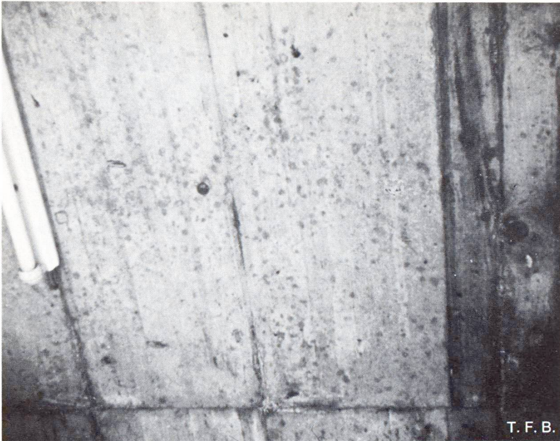
Abb. 4 Zu dünnflüssiger Beton war die Ursache für das Absinken der größeren Zuschlagsgesteine und für eine teilweise Entmischung zwischen Wasser und Zement im Bereich der Schalungsfläche. Die groben Körner des Zuschlages zeichnen sich als dunkle Punkte ab («durchscheinender Zuschlag»). Die unregelmässige Verteilung der Flecken ist auf entsprechende Vibratorwirkung zurückzuführen.

der nötigen Vorsicht erfolgen und so lange fortgesetzt werden, bis die Schalungsfläche überall durchfeuchtet ist. Das Nässen bewirkt gleichzeitig auch eine bessere Abdichtung der Schalungsfugen.