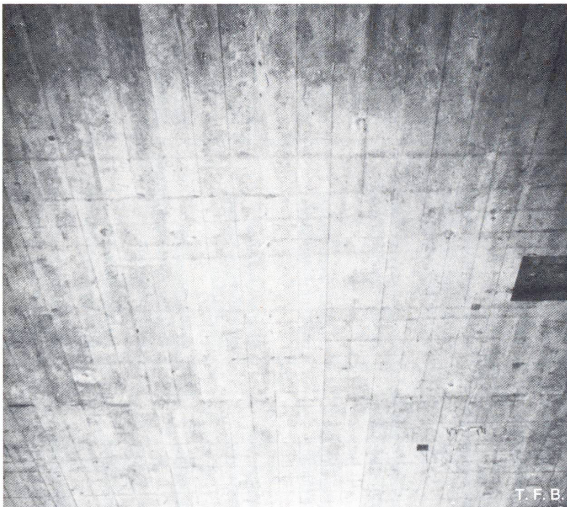
Abb.3 Strichförmige Rostflecken auf einer Betonunterseite. Stark rostige Bewehrungsstäbe wurden auf die Schalungsfläche ausgelegt und übertrugen dabei den Roststaub.