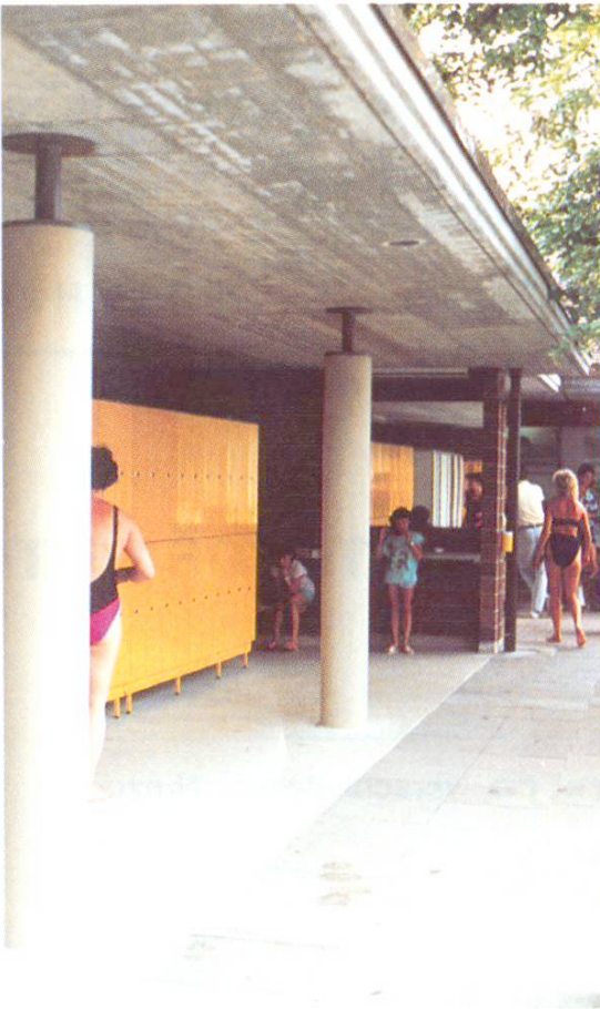
Einfacher Umkleidebereich. Wechselkabinen und Kleiderkästchen leicht zugänglich (Stansstad NW)