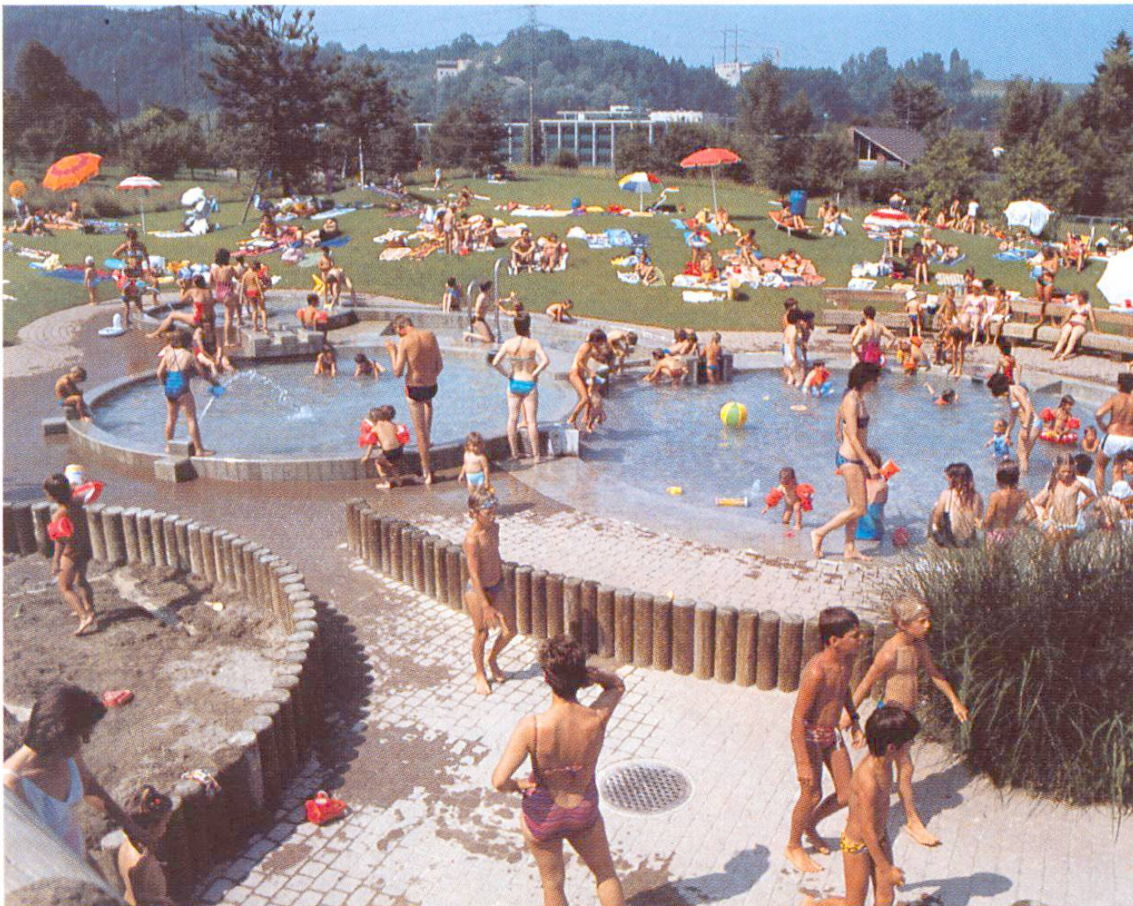
Pflotsch- und Wasserspielbereich für Kleinkinder (Birmensdorf ZH)