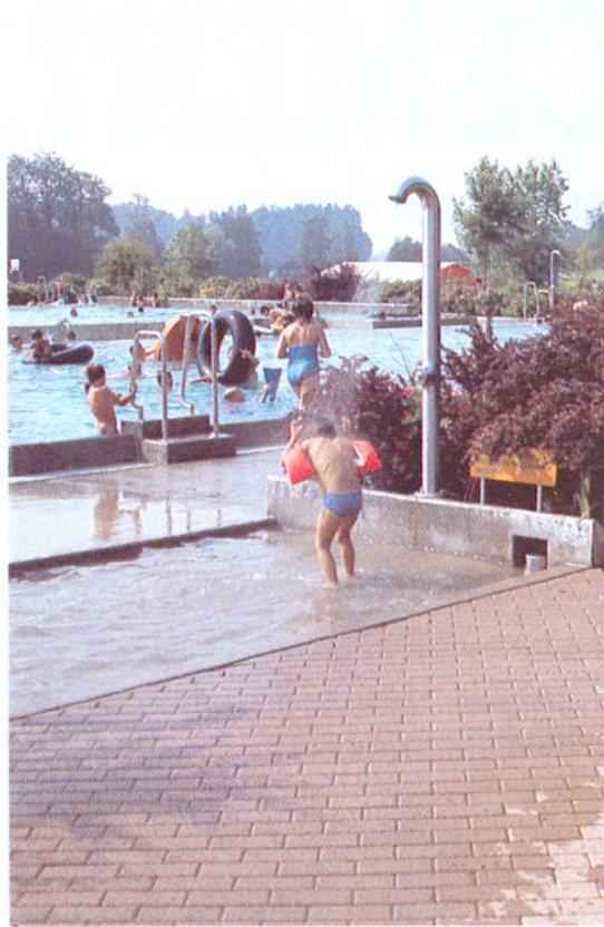
Zugang zum Beckenbereich über Durchschreibecken, kombiniert mit Duschen (Muri AG)

liegen in der Nähe des besiedelten Gebietes, sind aber nicht an ein See- oder Flussufer gebunden. Gebaut und betrieben werden sie meist von den Gemeinden.