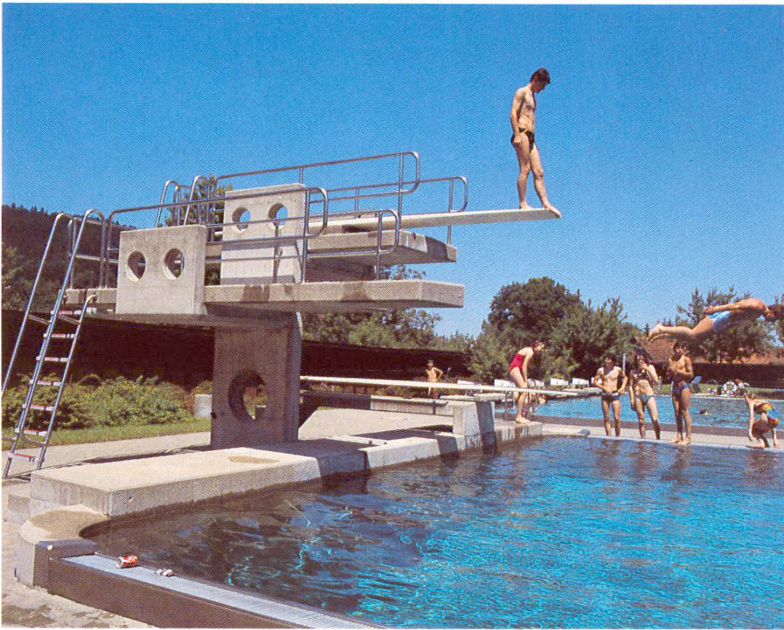
Sprungbecken und Sprungturm, eine Attraktion für alle Altersstufen (Oberuzwil SG)