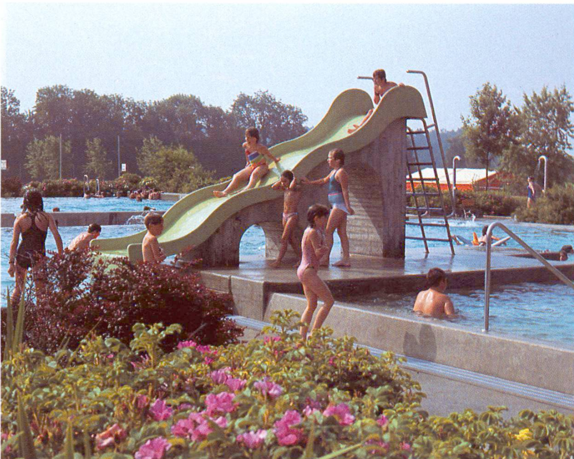
Flächenrutsche ins Tummelbecken – zu zweit geht's besser (Muri AG)