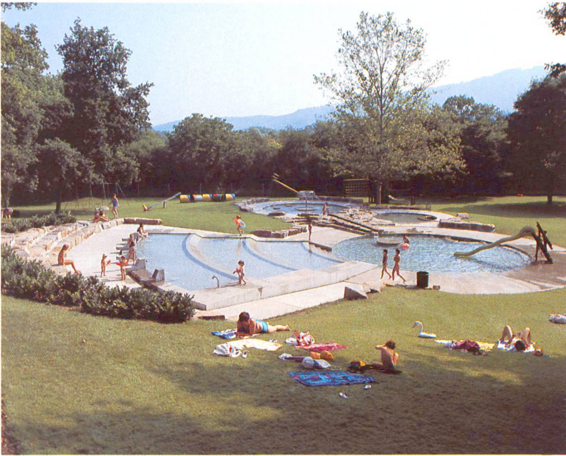
Kleinkinderbereich (Überblick). Wasserspiel-, Pflotsch-, Gerätespiel- und Liege-/Sitzzonen (Reinach BL)