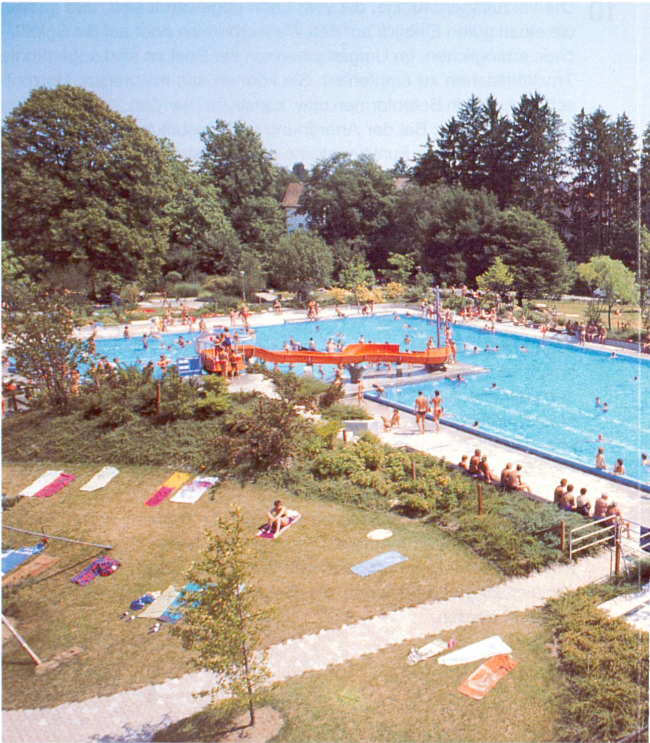
Mehrzweckbecken mit funktionsgetrennten Buchten für Schwimmen, Tummeln und Springen (Wallisellen ZH)

Eingangsbereich: Klare Verkehrstrennung und genügend Möglichkeiten zum Parkieren von Fahrrädern, Mopeds usw. Die Eingangspartie sollte einladend sein.