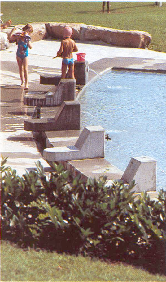
Wasserspeier mit Reguliermöglichkeit für Kinder (Reinach BL)