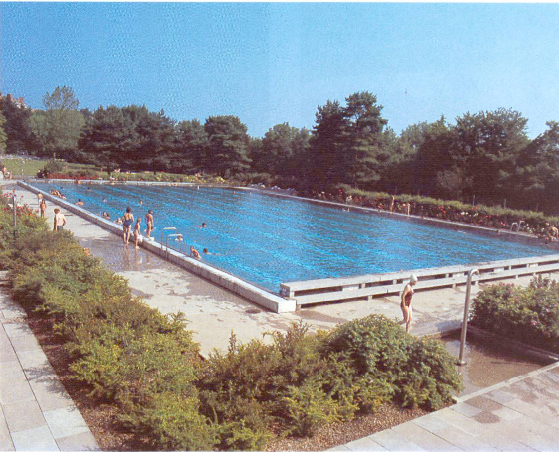
Schwimmerbecken mit Überflutungsrinne längsseitig und Startbank stirnseitig (Reinach BL)