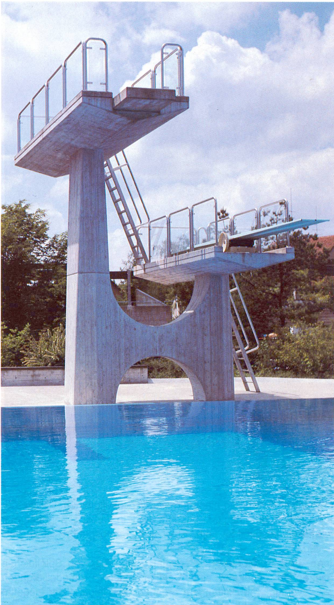
Sprungturm. Beispiel für Funktionalität und Ästhetik (Wallisellen ZH)