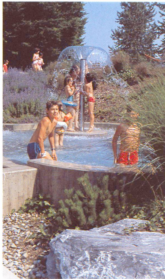
Wasserpilz, Wasserglocke. Spielelement für alle Altersstufen (Birmensdorf ZH)