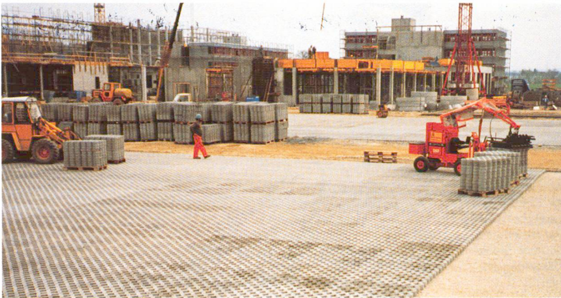
Abb. 4 Verlegen der Rasengittersteine: bei grösseren Flächen maschinell.

versehen. Sie ist massgebend für die Tragfähigkeit und die Dauerhaftigkeit des Platzes. Nur bei gutem Untergrund kann darauf verzichtet werden. Die Deckschicht besteht aus Verlegehilfe und Rasengitterstein. Für die Verlegehilfe wird am besten Splitt 3–6 mm oder gewaschener Sand verwendet. Bei ungewaschenem Sand besteht die Gefahr, dass diese Schicht mit der Zeit dicht wird. Die Rasengittersteine sind in den Stärken 8, 10 oder 12 cm erhältlich (für hohe Belastung gibt es noch stärkere Steine). Sie sind meist rechteckförmig und werden beim Verlegen stumpf gestossen. Spezialformen können eine Verbundwirkung erzielen. Ihre Oberflächen sind glatt oder gewellt. Die Kammern werden mit einem Sand-Humus-Gemisch knapp aufgefüllt, das sich noch leicht setzen wird, so dass der Verkehr auf den Betonrippen rollt. Für die Bepflanzung bestehen Samenmischungen [3, 5]. Zeitpunkt der Aussaat ist die Vegetationsperiode. Eine Schonzeit bis zum ersten Schnitt ist beim Rasengitterstein nicht erforderlich. Gegenüber dem Schotterrasen haben die Rasengittersteine den Nachteil, dass sich keine durchgehende Vegetationsschicht bilden kann. Ist aber gar keine Bepflanzung vorgesehen, so sollen die Kammern mit Splitt oder Sickerbeton gefüllt werden, damit die Versickerung gewährleistet bleibt.