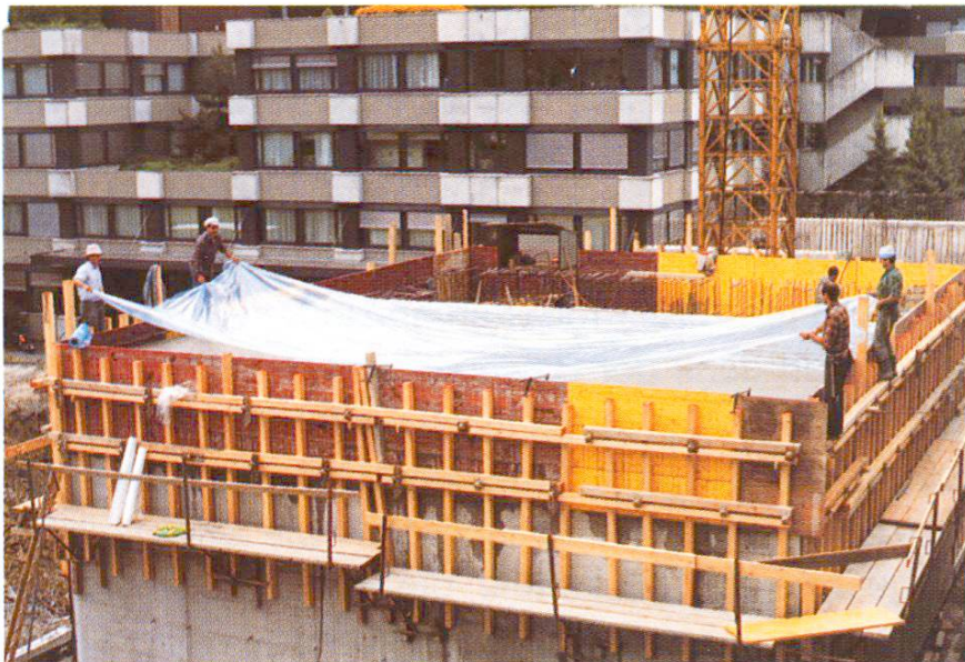
Abb. 13 Abdecken mit Bauplastik.