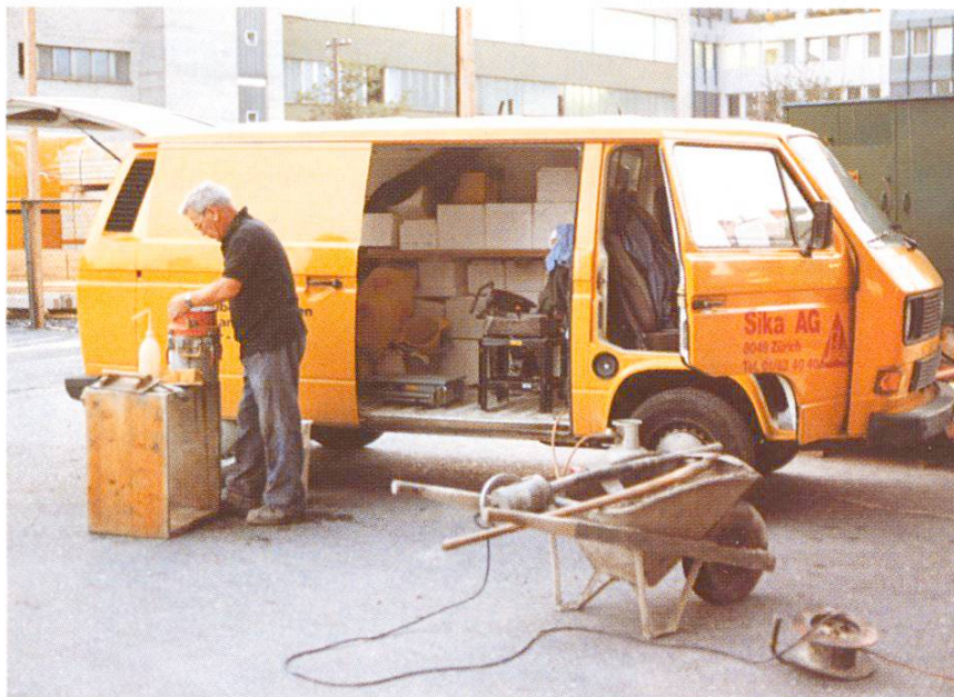
Abb. 2 Frischbetonkontrolle. Erhoben werden Rohdichte, Wassergehalt, Luftporengehalt, Verdichtungsmass und Frischbetontemperatur. Gleichzeitig: Herstellen von Probewürfeln für die Festigkeit.