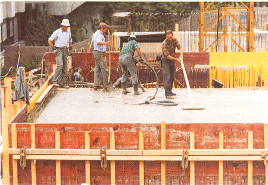
Abb. 12 Beendigung der Betonierarbeit an der Decke.