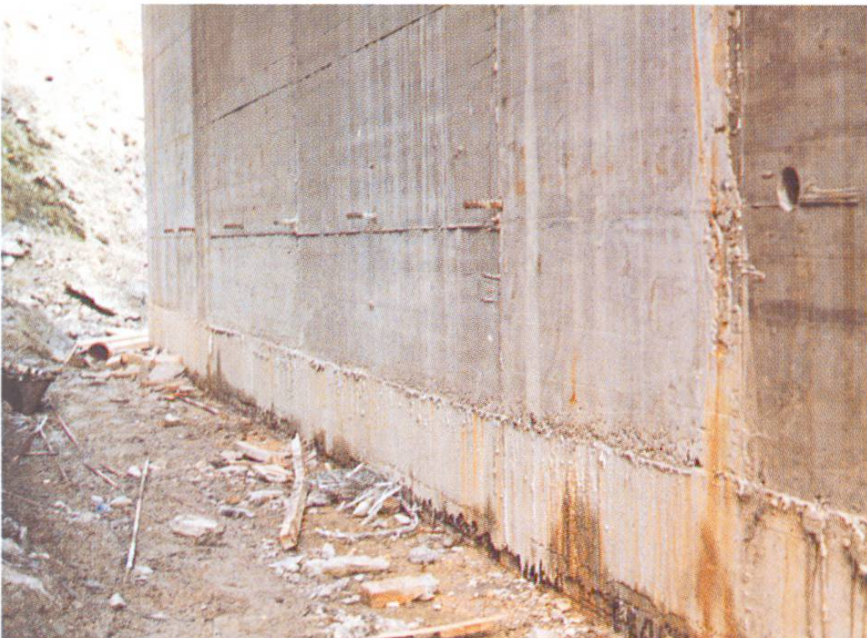
Abb. 8 Wand- anschluss ausen.

Konsistenz, Kornform und Farbe geben dem Frischbeton ein typisches Aussehen. Wirft der Polier auf der Baustelle einen Blick darauf, so erkennt er sofort, ob es sich allenfalls um eine Fehllieferung handelt. Er darf sie unter keinen Umständen einbringen.