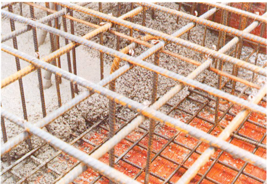
Abb. 11 Fortsetzung bei Deckenabsatz.