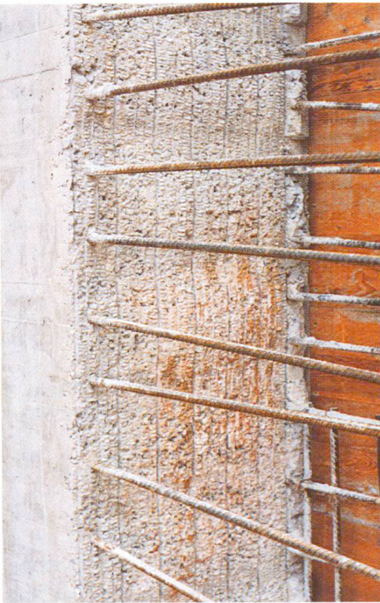
Abb. 3 Arbeitsfuge. Streckmetall wieder entfernt, gereinigt.