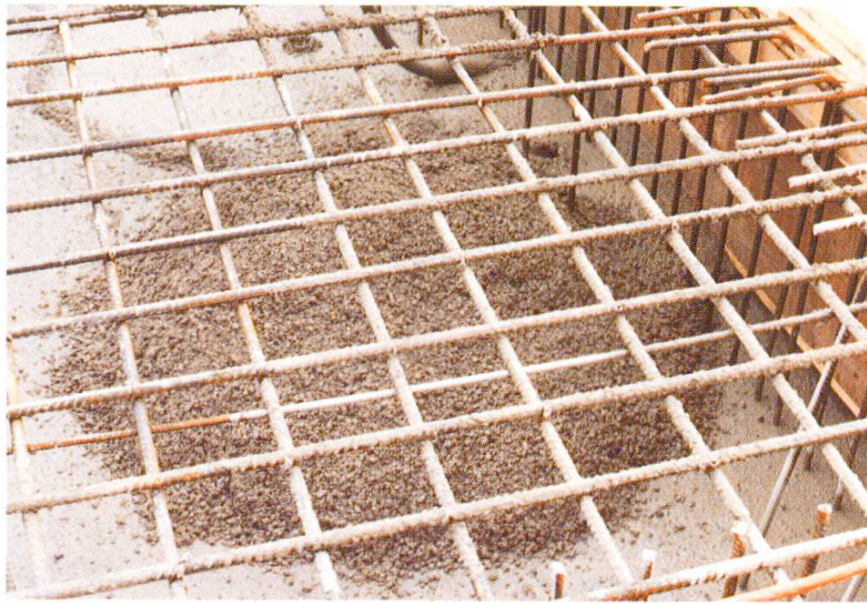
Abb. 9 Betonieren der Decke.