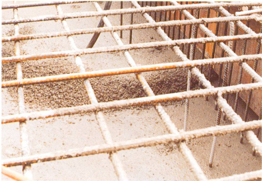
Abb. 10 Schichtweises Einbringen in Höhen von etwa 25 cm.