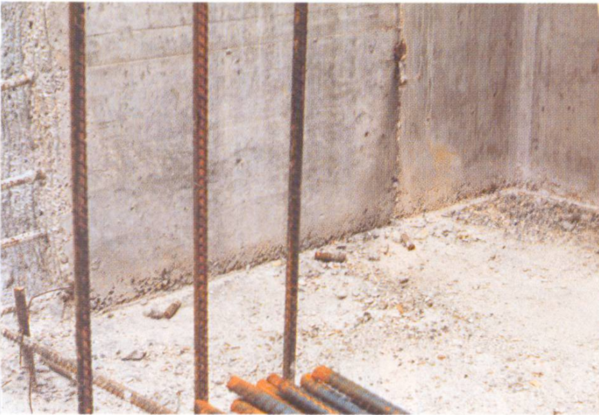
Abb. 7 Wand- anschluss innen.

Abb. 7 und 8: Saubere Wandanschlüsse infolge dichter Schalung (nur sehr geringer Verlust an Zementleim). Die Schalungsbinder verbleiben im Schwerbeton und werden abgeschnitten. Abb. 8 unten rechts: Wandstück in Normalbeton mit üblichem Bindloch.