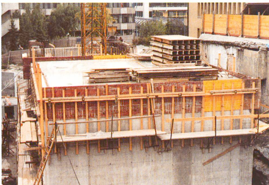
Abb. 14 Feuchthalten durch fortwährendes Wässern während 7 Tagen.