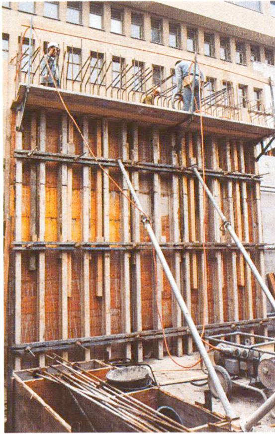
Abb. 4 Wandschalung, etwa 4 m hoch.