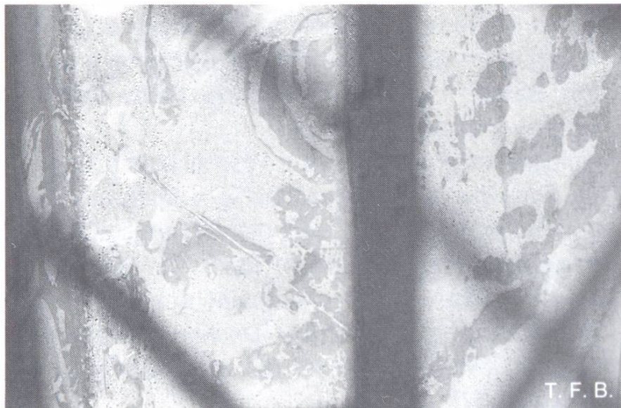
Abb. 3 Nahaufnahme: Die austretende Feuchtigkeit kann nicht entweichen, sie kondensiert am Plastik. Dadurch bleibt die Oberfläche in einem günstigen Klima