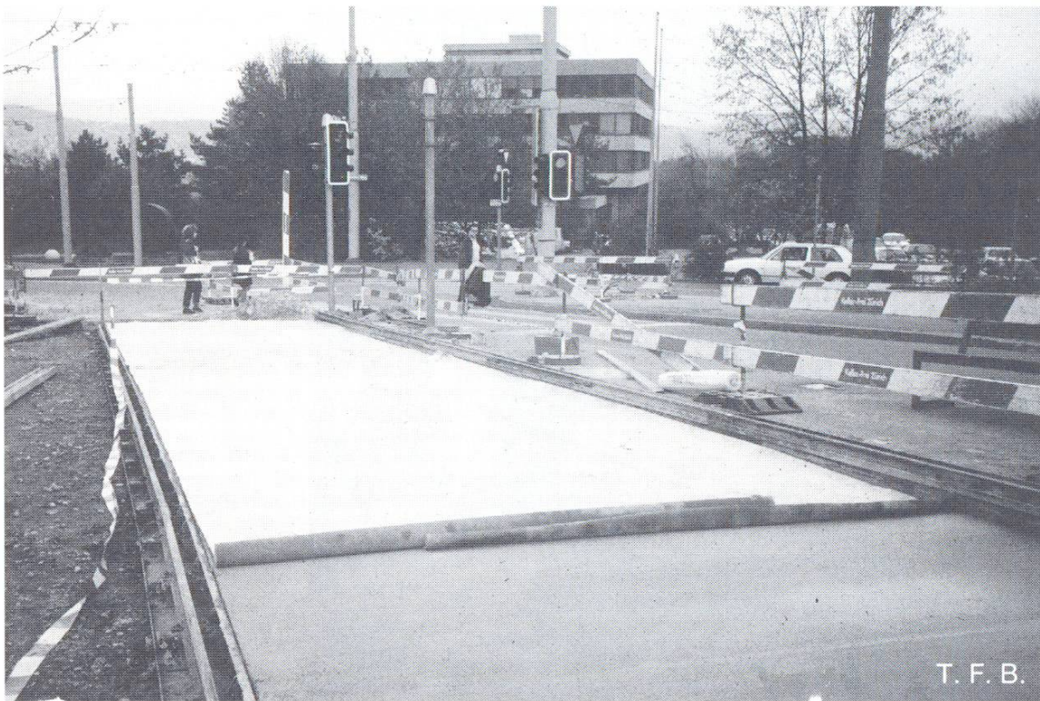
Abb. 4 Betonbelag für Bushaltestelle. Curing compound als Nachbehandlung und Isolationsmatten als Schutz gegen Witterung und innere Temperaturdifferenzen (Haltestelle «Strassenverkehrsamt» an der Uetlibergstrasse in Zürich)

Als Bauleiter ist der Planer dem Bauherrn gegenüber verantwortlich für die Bauaufsicht. Dazu gehört die Überprüfung des Bauprogramms sowie der Massnahmen für die Nachbehandlung [SIA 162, Art. 74]. Je nach Baustelle wird die Nachbehandlung den Baufortschritt auf dem kritischen Weg beeinflussen. Insbesondere wird dort ein Kompromiss zu finden sein, wo man einerseits den Beton möglichst lange feucht halten will und andererseits auf baldige Bauaus-trocknung drängt. In anderen Fällen gelingen Arbeitsetappen, ohne dass die Dauer der Nachbehandlung für den Baufortschritt massgebend wird. Bei gut geführten Baustellen werden die betontechnologischen Zusammenhänge auf Stufe Planung berücksichtigt [4, 5]. Diese Aufgabe ist vor allem dann etwas einfacher, wenn auch der Bauherr über ein Fachorgan verfügt. Schwieriger hat es jener Bauleiter, der die Verantwortung für die Betontechnologie alleine trägt. Er steht zwischen den Bauherrn, der auf den Termin drückt, und dem Unternehmer, der seinen Aufwand minimieren will. Es ist von Vorteil, wenn die Nachbehandlung separat positioniert ist, weil sie dann auch in den Kosten offen ausgewiesen und abgerechnet werden kann.