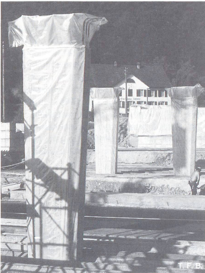
Abb. 2 Pfeiler und Widerlager einer Strassenüberführung. Der Beton ist mit Plastik eingepackt. Zweck: Nachbehandlung des Betons und Schutz der Sichtfläche vor Rostfahnen der Anschlussbewehrung oder vor Kalkschnäuzen infolge Regenwassers (Kanton Aargau: Brücke K 364, Juli 1988)