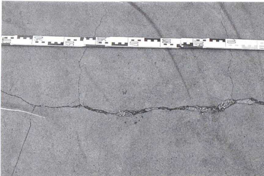
Abb. 3 Weitmaschige Risse mit Hohlstelle. Grund: schlechte Verdichtung der untersten Schicht und falsche Materialzusammensetzung.

man ihn verzögert und einige Stunden lagert. Weil er während dieser Zeit austrocknen kann, muss er unbedingt abgedeckt werden.