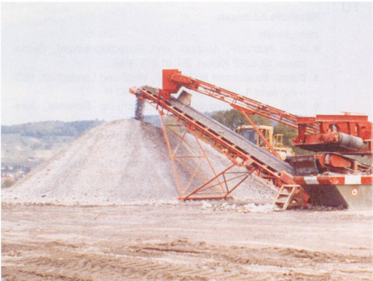
Bauschutt-Aufbereitungsanlage in Betrieb.