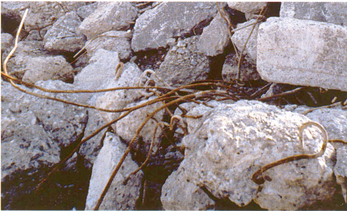
Netzbewehrter roher Betonstrassenabbruch, der nach geeigneter Aufarbeitung zu einem wertvollen Rohstoff beim Ausbau der N 13 im St.Galler Rheintal wurde.

Eigentlich ist Betongranulat zu wertvoll, um für Bodenstabilisierungen eingesetzt zu werden. Dennoch ist dies ein wichtiger Anwendungsbereich [13]. So dient auf der bereits erwähnten Ausbaustrecke der Rheintalautobahn (N 13) gebrochener alter Betonbelag der Korngrößenverteilung 0–32 mm mit einer minimalen Zementdosierung ( 60 \text{ kg/m}^3 ) als Foundationsschicht.