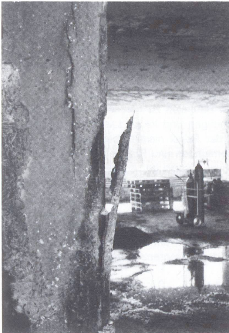
Abb. 4. Abplatzungen an einer brandgeschädigten Stütze.

Die Eindringtiefe der chloridhaltigen Lösungen hängt stark vom Zustand des Betons ab: Vergrößerungen des Porenraumes, Gefügestörungen (Abplatzungen und Risse) begünstigen ein tiefes Eindringen. Durch Reaktion mit Calciumhydroxid in der Betonmatrix entsteht gut wasserlösliches Calciumchlorid, das selbst in einem nur wenig brandgeschädigten Beton durch Poren als Transportwege und Wasser als Transportmedium – oft erst im Verlauf von Monaten und