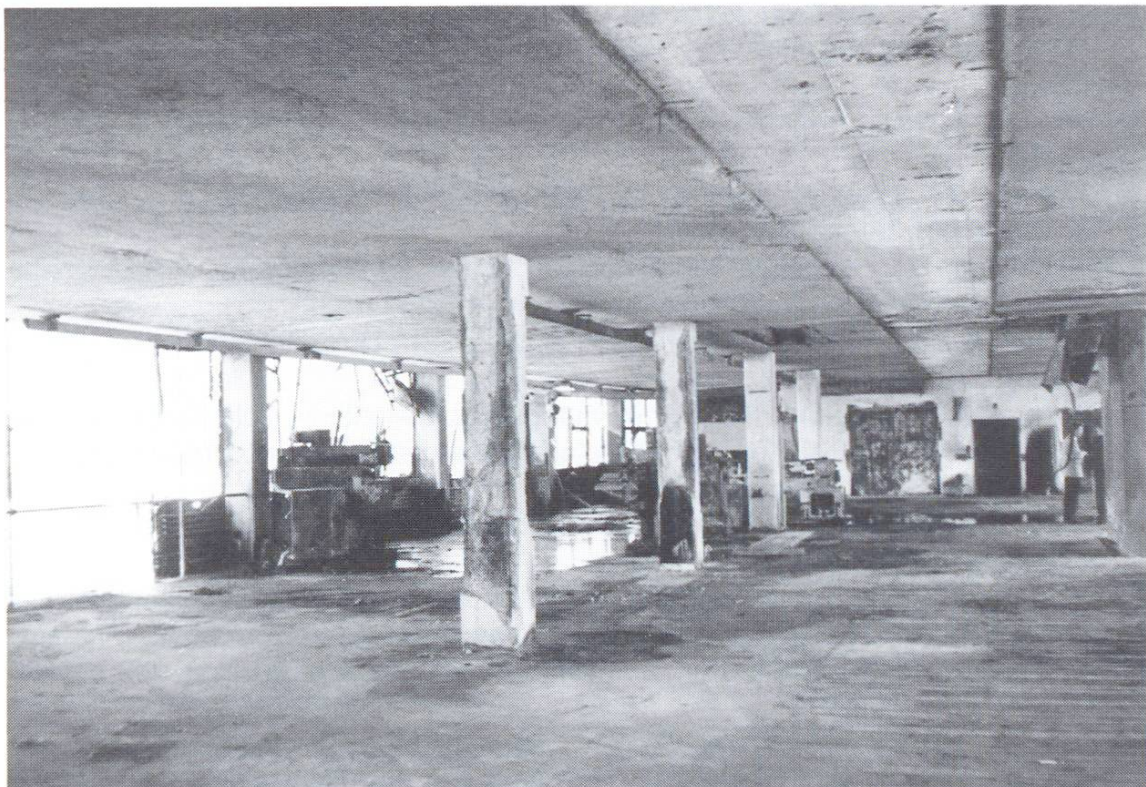
Abb. 2. Innenaufnahme aus dem in Abbildung 1 gezeigten Gebäude.

Zu berücksichtigen ist auch der Abschreckeffekt des Löschwassers bei freigelegten Bewehrungen, der je nach Stahlart eine Versprödung oder gar eine Verfestigung bewirkt [11]. Die Wärmedehnung des Stahls ist bei erhöhten Temperaturen grösser als diejenige des