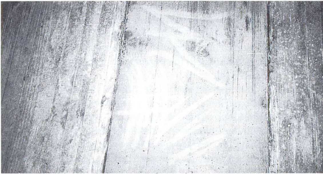
Schalungstrennmittel, in zu hoher Konzentration aufgetragen, können Anlass zu abmehlenden oder absandenden Betonoberflächen sein.