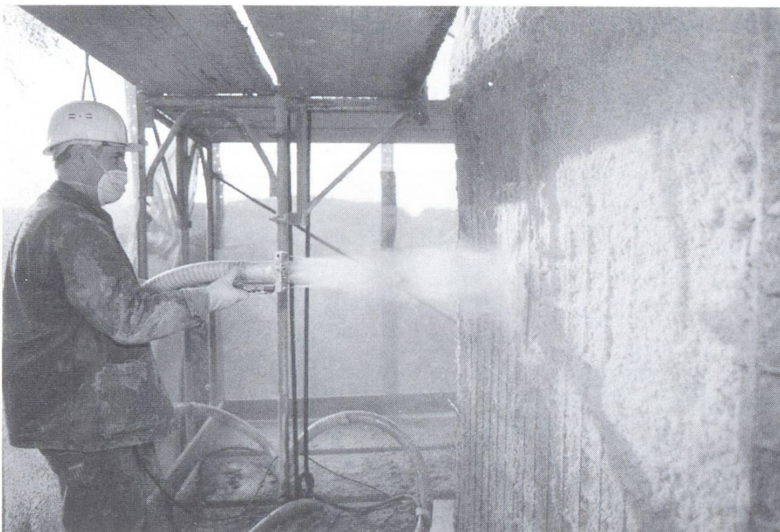
Überdecken des Anodennetzes mit feuchten Papierfasern.

Sobald sichtbare Korrosionsschäden vorhanden sind, wird das Realkalisierungsverfahren mit dem aufwendigen vollständigen Abtragen des Betons bis zur Bewehrung, gefolgt vom Entrosten des geschädigten Stahls und Reprofilierung, meist mit Spritzbeton, in Konkurrenz treten. Statisch heikle Stahlbetonbauten mit kleinen Querschnitten, beispielsweise Silobauten, Kühltürme oder Wassertürme, sind weitere Sanierungsfälle, bei denen elektrochemische Realkalisierungen erwogen werden können.