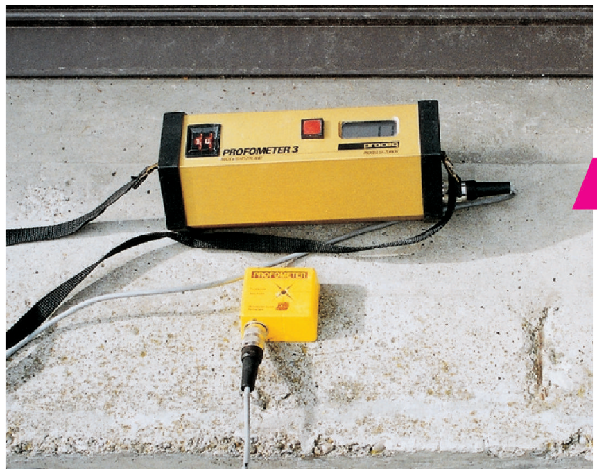
Messung der Überdeckung eines korrosionsgeschädigten Fenstersimses.