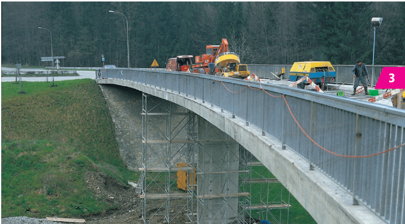
Sanierung einer Betonbrücke.