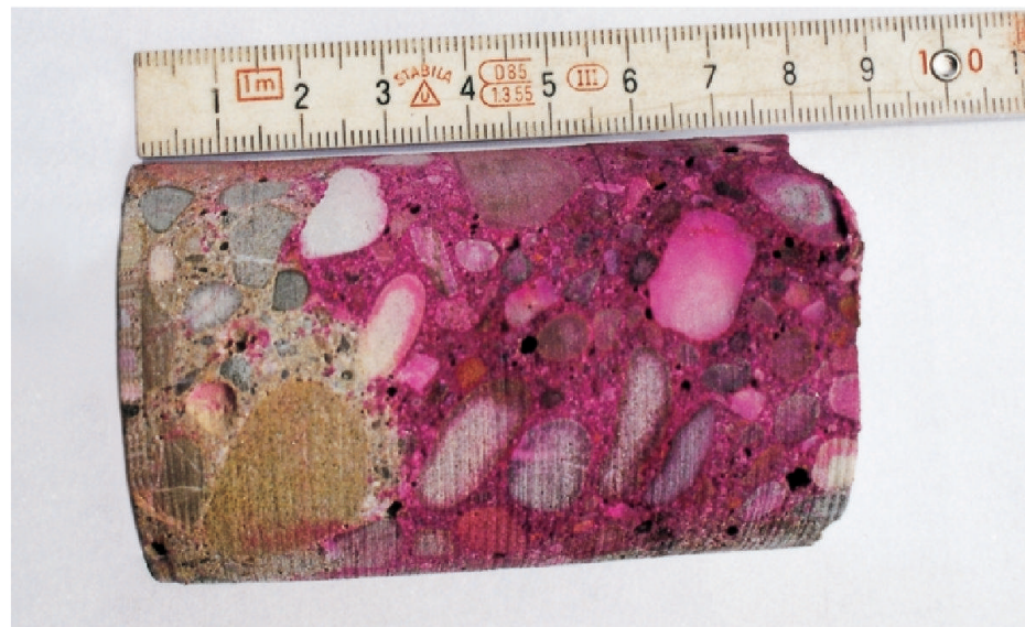
Nachweis der Karbonatisierungstiefe mit Phenolphthalein an Bohrkern.

Erhaltungsmassnahmen müssen sorgfältig geplant und begründet werden. Die wichtigsten Instand-