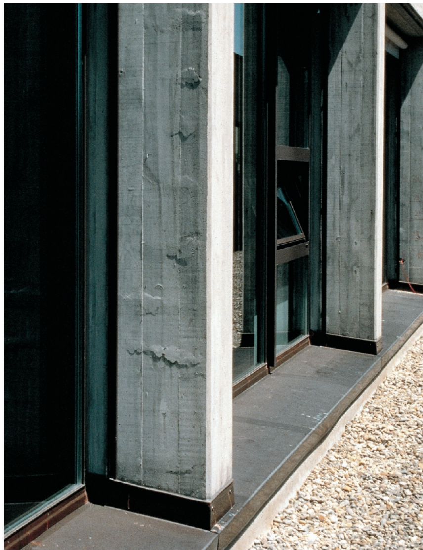
Korrosionsschäden an Stützen.