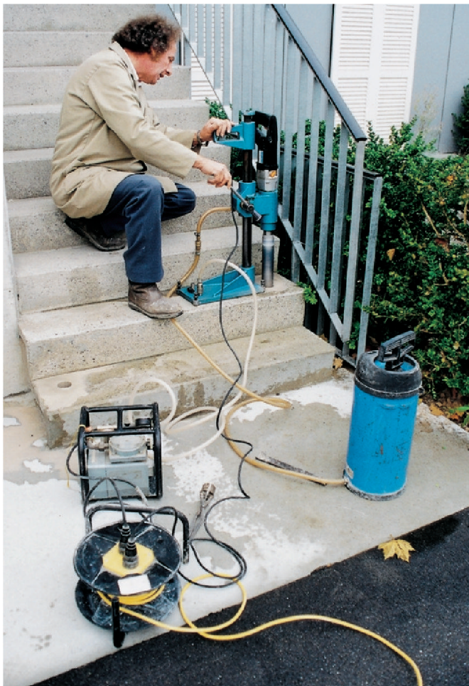
Bohrkernentnahme als Teil einer zerstörenden Untersuchung.

Für die zerstörungsfreie Untersuchung von Tragwerken sind zahlreiche Methoden entwickelt worden; sie sind im Anhang A1 der Empfehlung SIA 162/5 [6] zusammengefasst. Am häufigsten eingesetzt werden