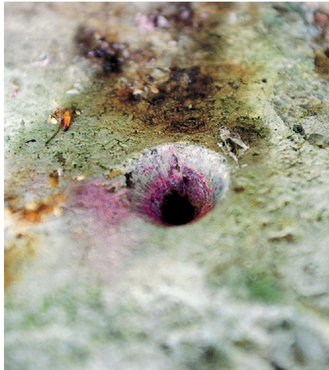
Einfache Bestimmung der Karbonatierungstiefe (Phenolphthaleintest).