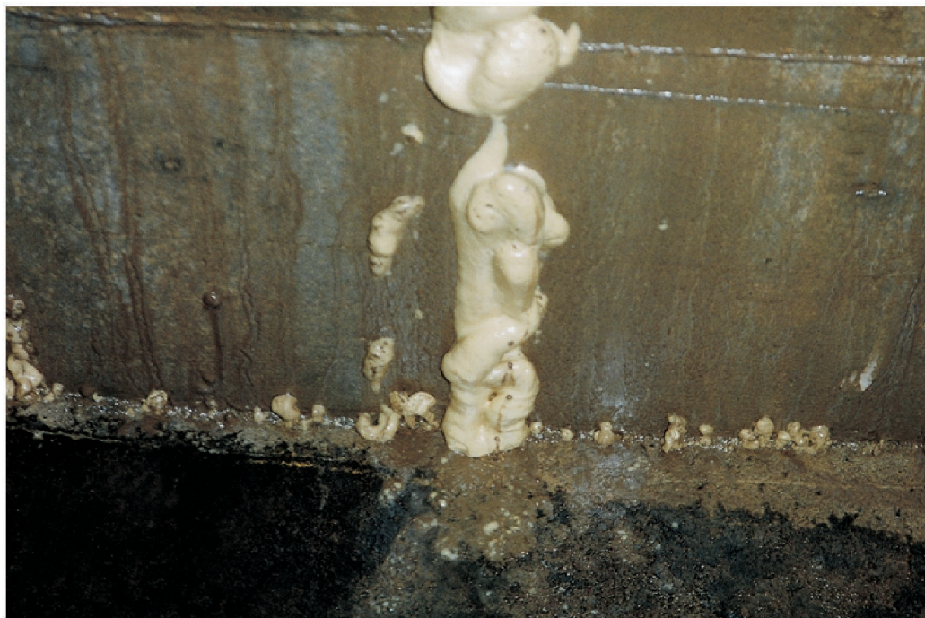
Wasserstop durch PUR-Injektion.