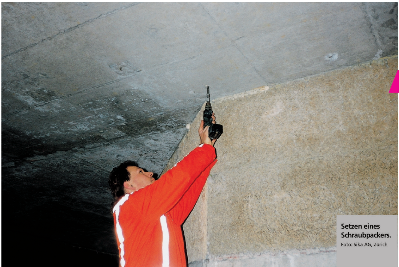
Setzen eines Schraubpackers.