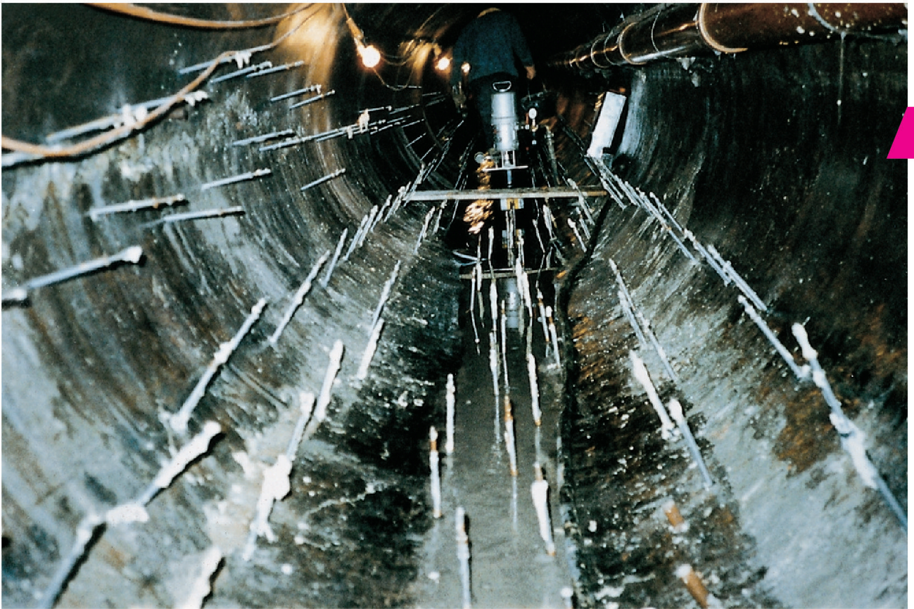
Im Boden-/Sohlenbereich einer Betonkanalisation gesetzte Packer.