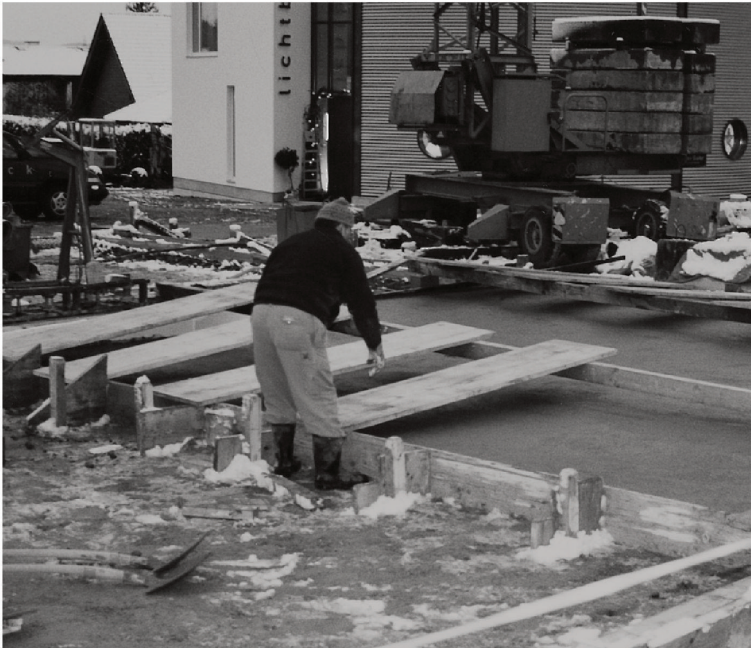
Vorbereitung der Isolation einer frisch betonierten Bodenplatte.

von der Schnelligkeit der Wärmeentwicklung und dem Ausmass der Wärmeabgabe an die Umgebung ab. Die Geschwindigkeit von chemischen Reaktionen ist temperaturabhängig: je tiefer die Temperatur, desto langsamer ist eine Reaktion. Dies gilt auch für die Hydratation. Aus praktischen Gründen wird angenommen, dass diese ab etwa -5 bis -10 °C stoppt, da nur noch wenig Wasser ( < 5 %) nicht gefroren ist und für chemische Reaktionen zur Verfügung steht. Bei Temperaturerhöhung setzt die Hydratation wieder ein. Beton, in dem sich im frühen Stadium der Festigkeitsentwicklung einmal Eis gebildet hat, erreicht nur etwa die Hälfte der vorgesehenen Endfestigkeit. Zurückzuführen ist dies auf die Volumenzunahme um 9 % von gefrierendem Porenwasser. Dadurch entstehen Spannungen, die die Zugfestigkeit des jungen Betons übersteigen und ihn schädigen.