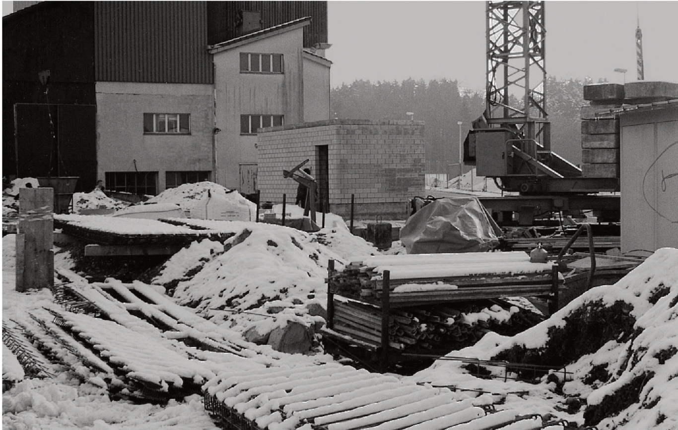
Betonieren im Winter.

Auch bei tiefen Temperaturen kann betoniert werden, wenn die notwendigen Vorkehrungen getroffen werden.