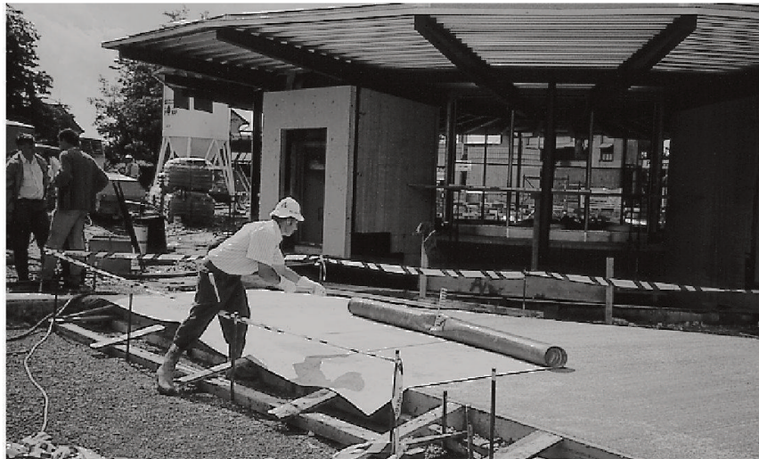
Abdecken eines frisch eingebauten Betonbelags mit Thermomatten.

Die Abdeckungen müssen ständig feucht gehalten werden, andernfalls