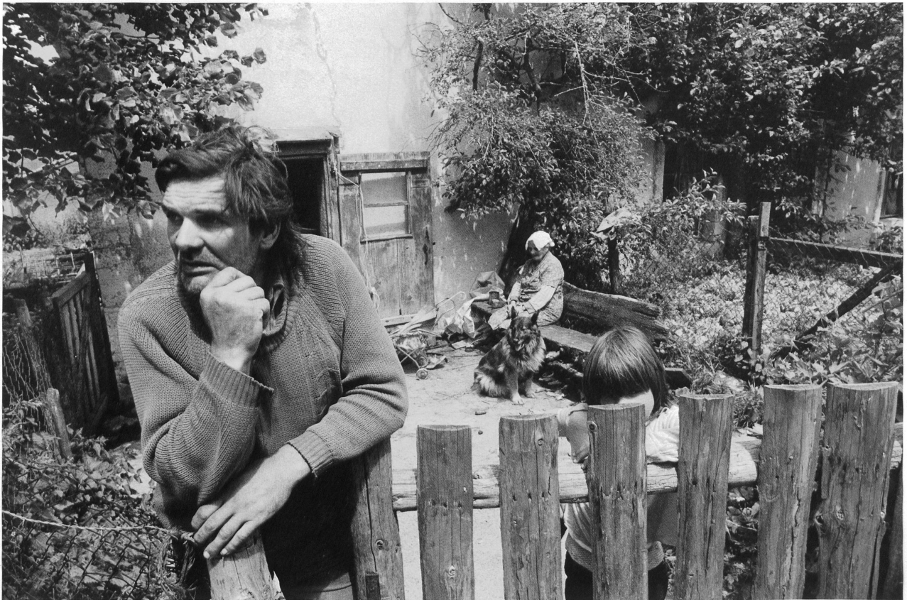
Hors du temps, Les Envers / Die Zeit steht still, Les Envers