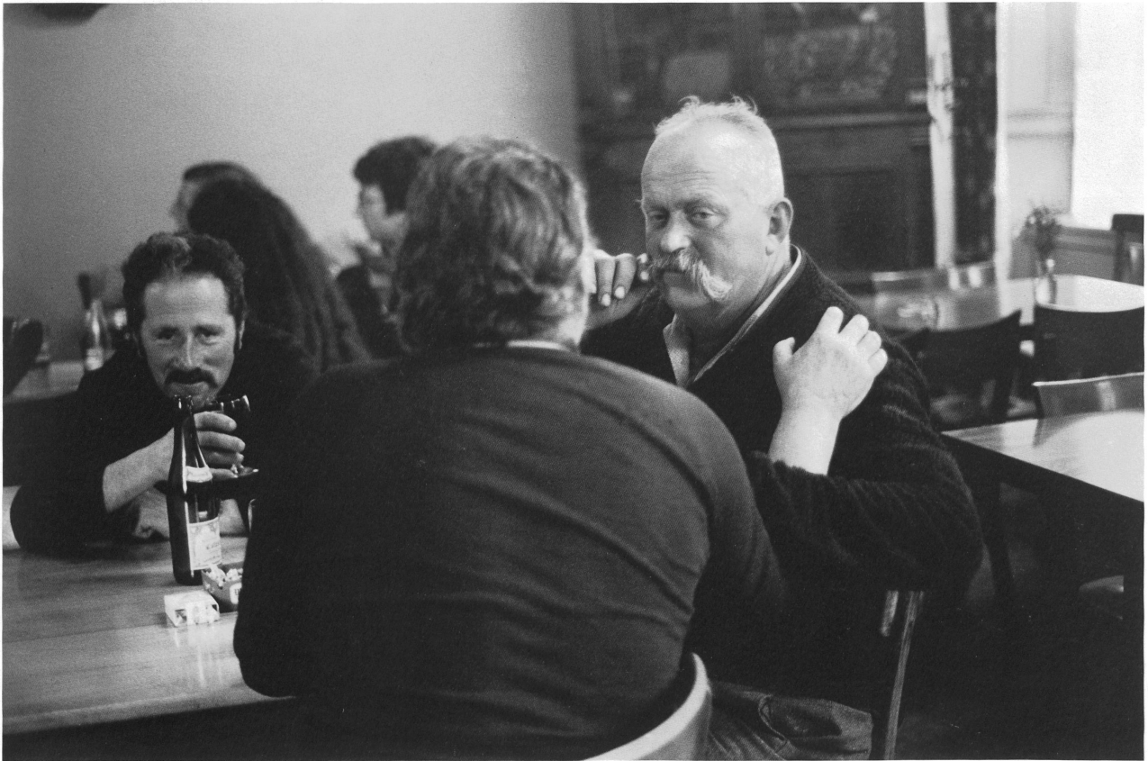
L'heure de la vérité, Lajoux / Stunde der Wahrheit, Lajoux