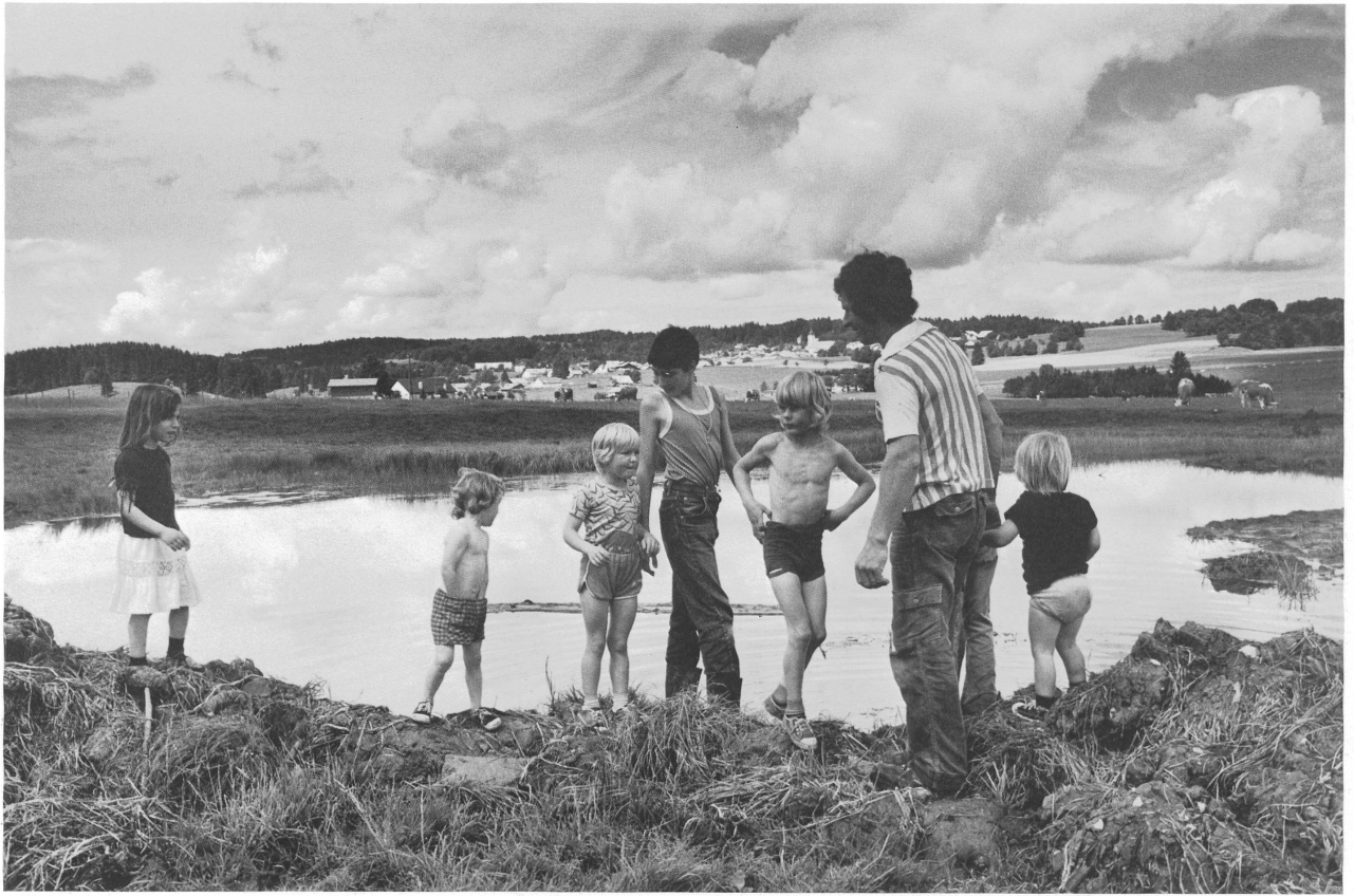
Balade après l'orage, Les Breuleux / Kleiner Spaziergang nach dem Gewitter, Les Breuleux