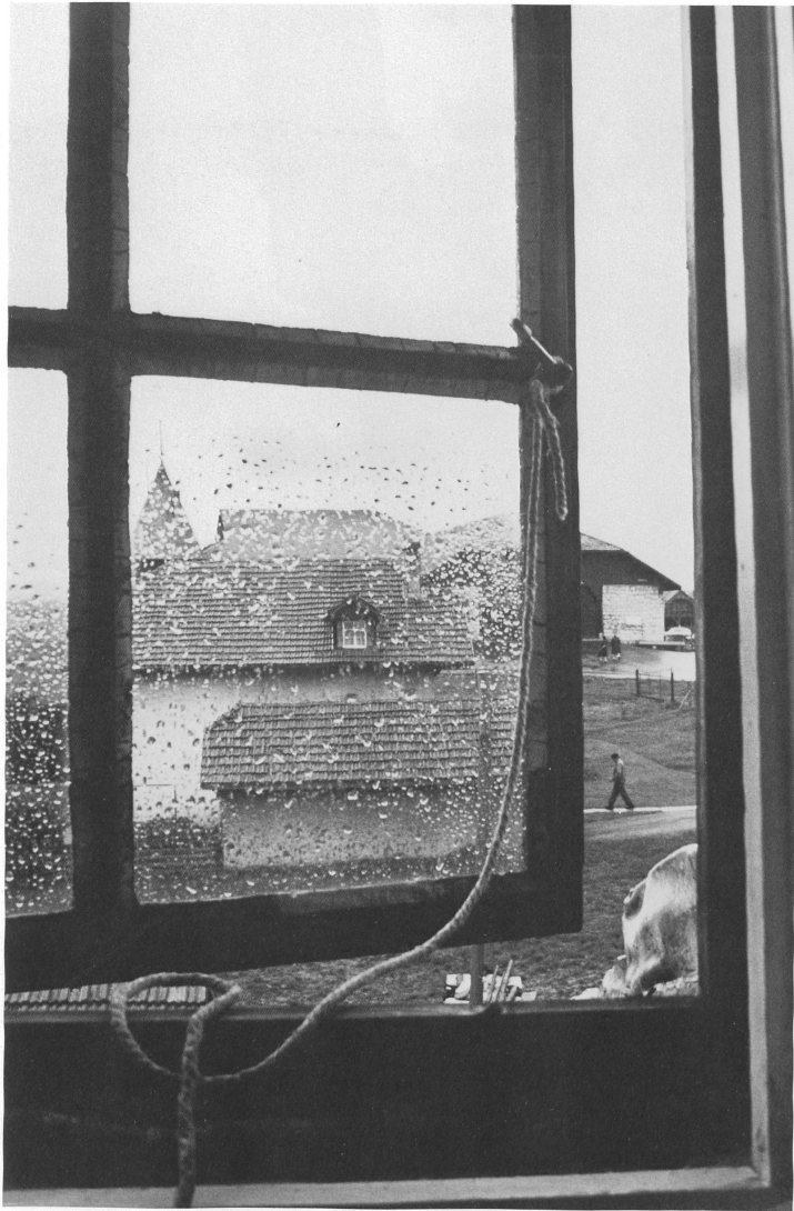
De ma fenêtre, Saignelégier Aus meinem Fenster, Saignelégier