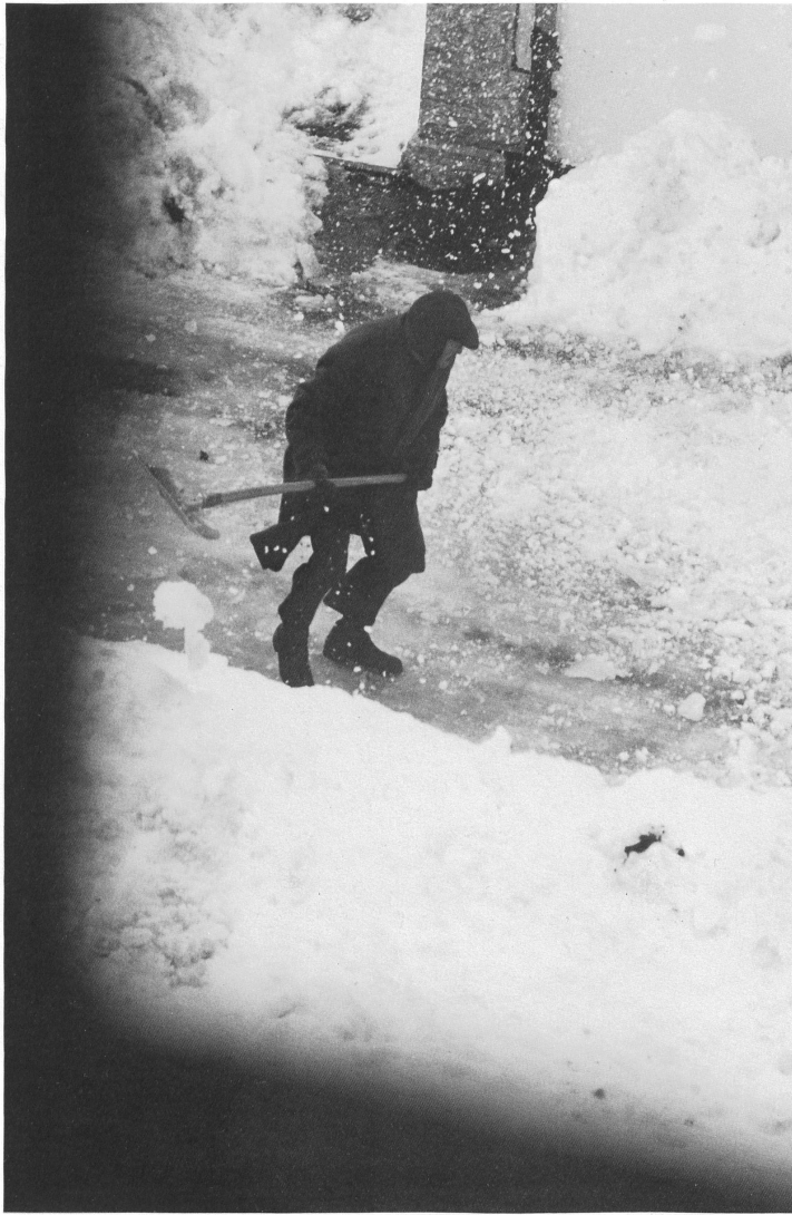
Bourrasque, Saignelégier Windstoss, Saignelégier