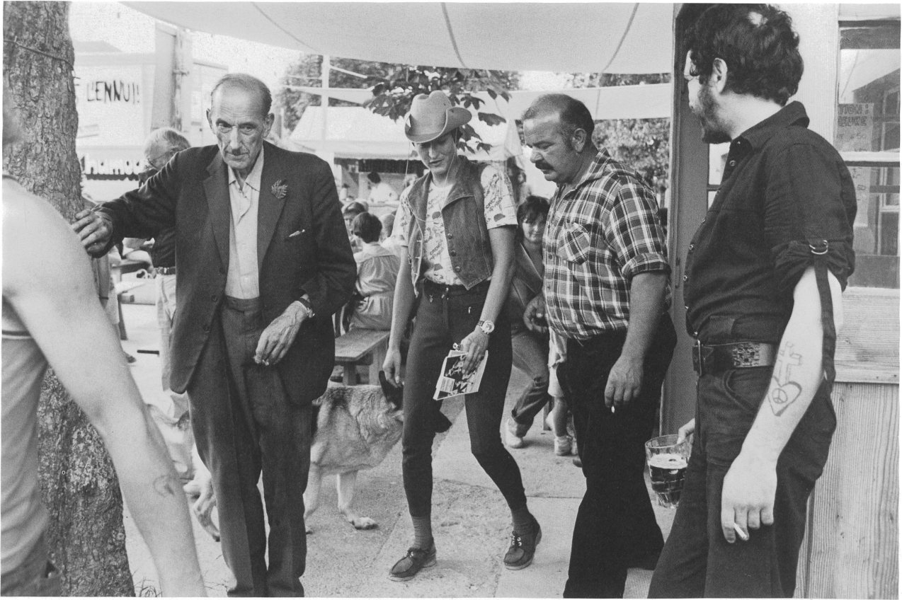
A bas l'ennui, Saignelégier / Weg mit der Langeweile, Saignelégier