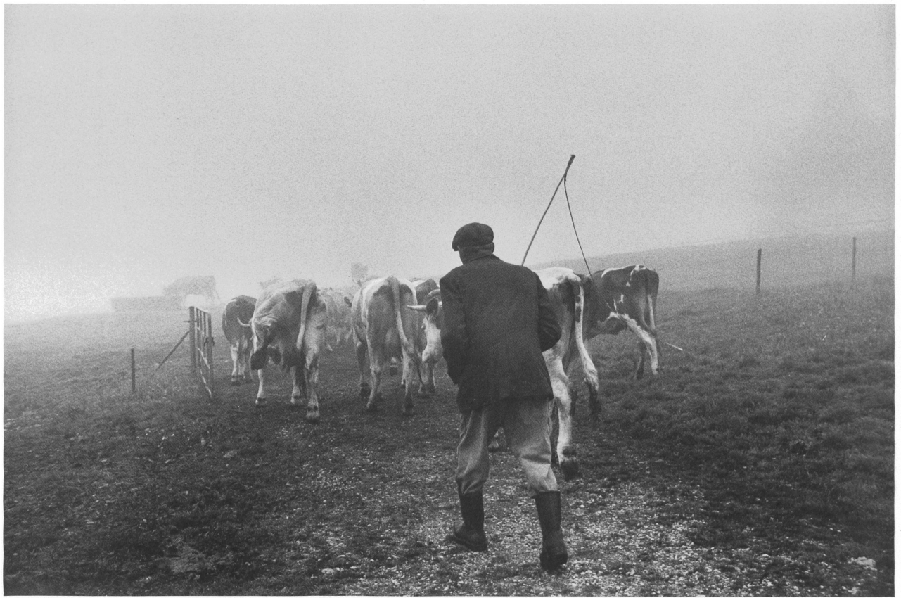
Le troupeau, Saignelégier / Die Herde, Saignelégier