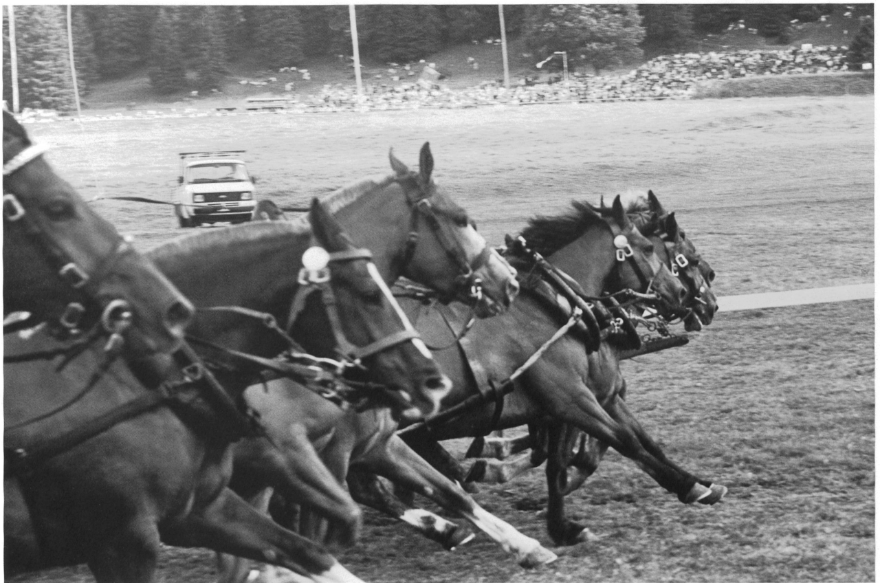
Au Marché-Concours, Saignelégier / Beim «Marché-Concours», Saignelégier