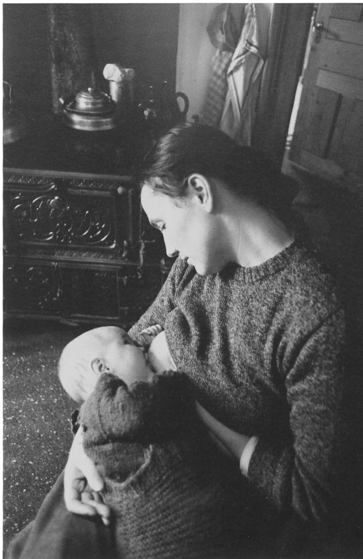
Chez «Lafleur», Montfaucon Bei «Lafleur», Montfaucon