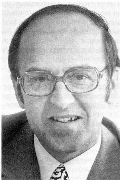
Kurt Furgler President of the Confederation Federal Department of Justice and Police