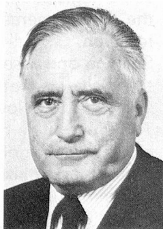
Georges-André Chevallaz Federal Department of Finance and Customs