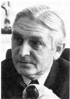
Ernst Brugger Federal Department of Public Economy