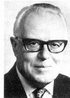
Pierre Graber Federal Political Department