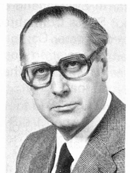
Hans Hürlimann Federal Department of the Interior