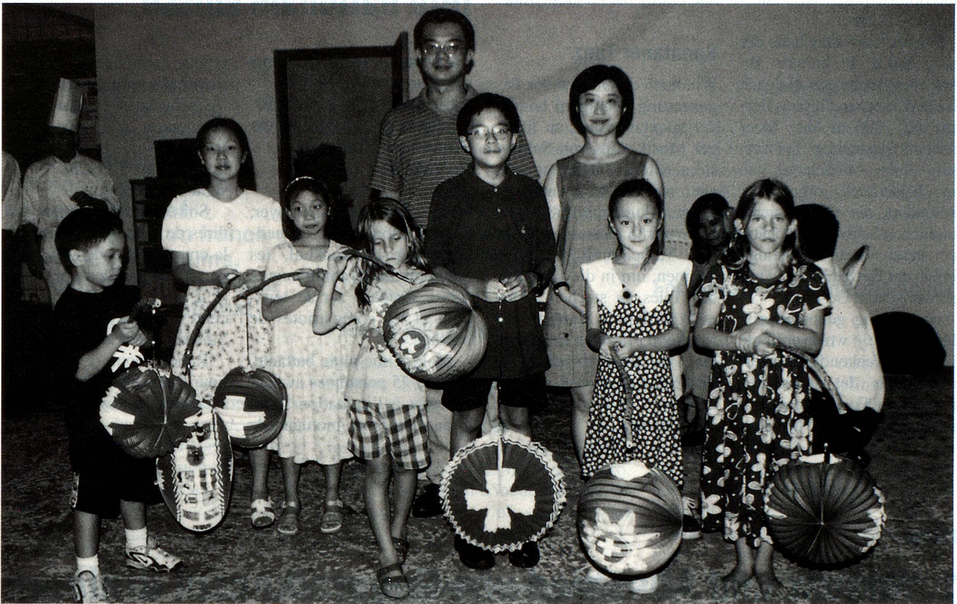
Die Jugend leuchtet auf dem Weg voran.

Über 70 Landsleute feierten den Tag der Heimat in Taipei bei einem gemütlichen Nachtessen, während eine Gruppe von Ordensfrauen und Missionaren morgens einen Gottesdienst feierte und in die Berge wanderte.