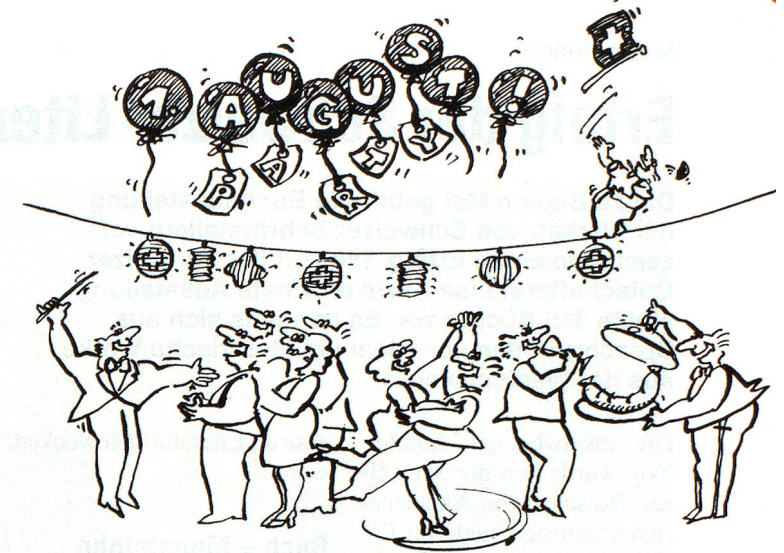
So wurde in Ungarn zur Bundesfeier eingeladen... (Cartoon Fredl Hofmann, Horgen)

Back at the Lodge most of our group played games. The next day after breakfast some of the group went for horse riding while others went visiting the neighbouring