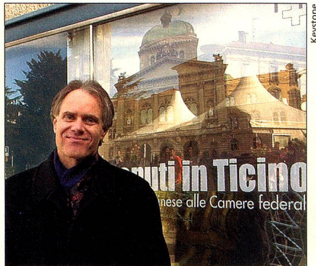
Federal President Moritz Leuenberger in Lugano.

But the business trip to Lugano did not just consist of excursions and social functions: the houses of parliament finally approved a revision of the penal code on abortion. Taking the reservations of the Christian Democrats (CVP) into account, the solution approved by both houses permits abortions within the first 12 weeks of pregnancy. But the CVP, supported by parts