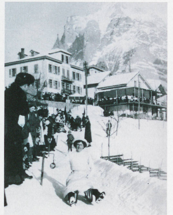
The "Village Run" toboggan race in Grindelwald