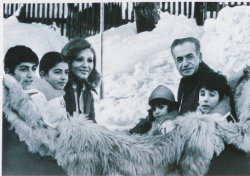
The Shah of Persia with his family in St. Moritz, 1975