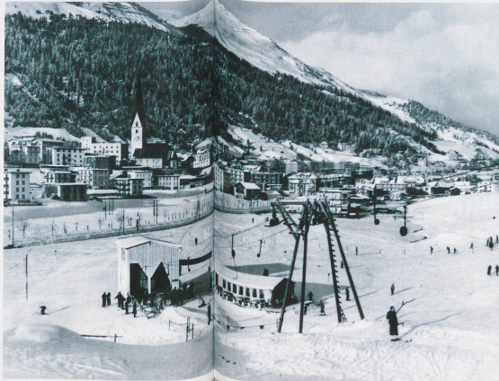
The "Bolgenlift" in Davos was the world's first toboggan run. Photo from winter 1934/35