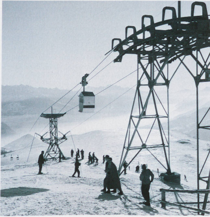
Switzerland's first cable car in Crans-Montana, 1950