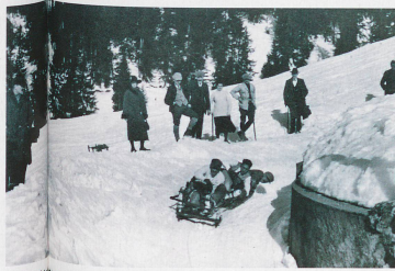
The "wildpögen run" in Crans-Montana