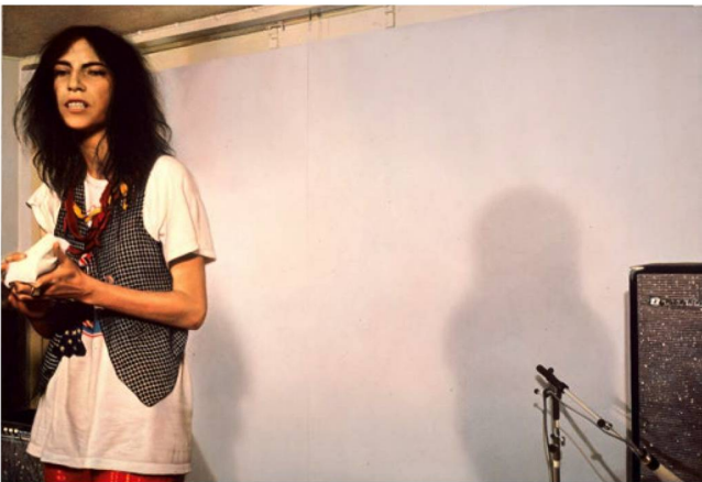
Franz Gertsch: "Patti Smith II", 1978