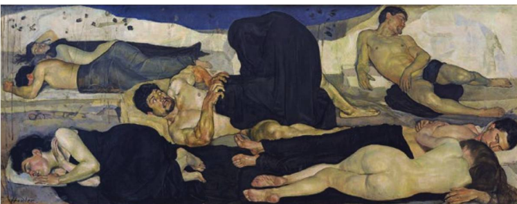
Ferdinand Hodler: "The Night", 1889