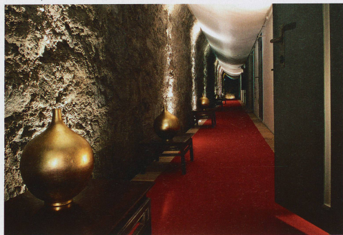
L'entrée de l'établissement hôtelier La Claustra

L'ancien bunker gouvernemental d'Amsteg abrite aujourd'hui le siège de Swiss Data Safe et Swiss Gold Safe