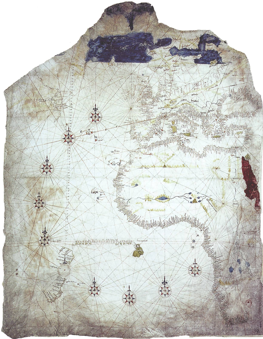
Abb. 1 Anonymus: Atlantische Küsten (ca. 1506; „Kunstmann III“). München, Wehrkreisbücherei VII, seit 1945 verschollen; Nachzeichnung von Otto Progel 1836/1843 (80 cm x 104 cm, Bibliothèque Nationale Paris, Rés. Ge.B. 1120).

Der einzige Meridian mit der Breiteneinteilung von 0° bis 68° Nord ist im Atlantik eingezeichnet und fast identisch mit der spanisch-portugiesischen Demarkationslinie von Tordesillas von 1494. Die Karte ist - chronologisch gesehen - nach Pedro Reinels Atlantik-Karte von ca. 1504 die zweite bekannte Karte mit der Graduierung der geographischen Breite und zugleich die zweite bekannte Karte mit der Darstellung des neuen Typus der Kompaßrosen, die eindeutig von den Portugiesen eingeführt worden waren. Im Gegensatz zu den meisten anderen Portolankarten der