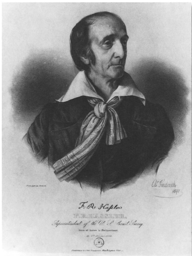
Ferdinand Rudolf Hassler aged 71 years, 1841.

Federal Office of Metrology Lindenweg 50, Wabern