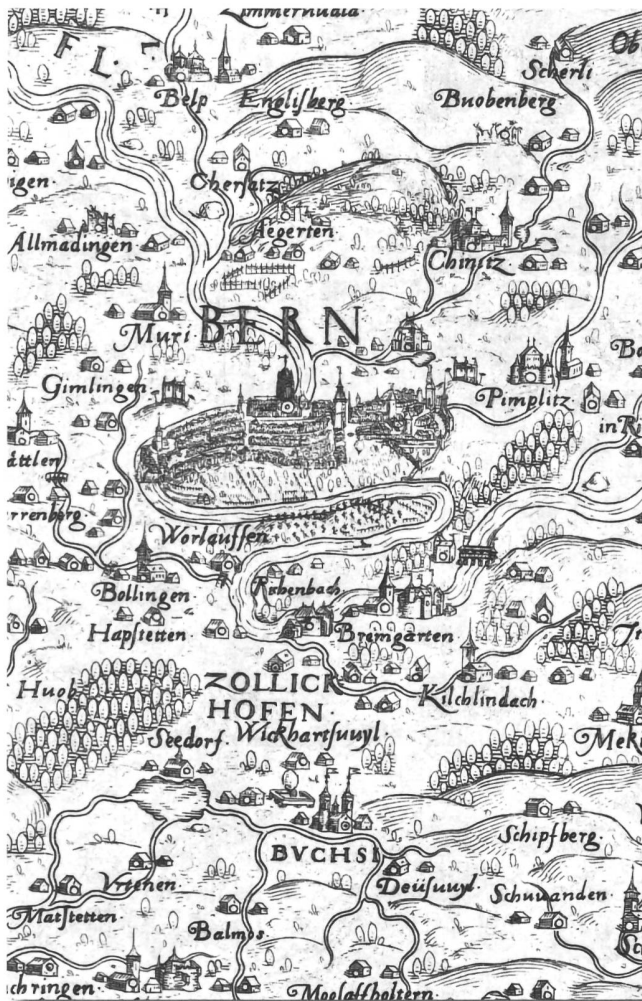
Map of the Bernese territory, by Thomas Schoepf, 1577/78.

State Archives of Berne Falkenplatz 4, Berne