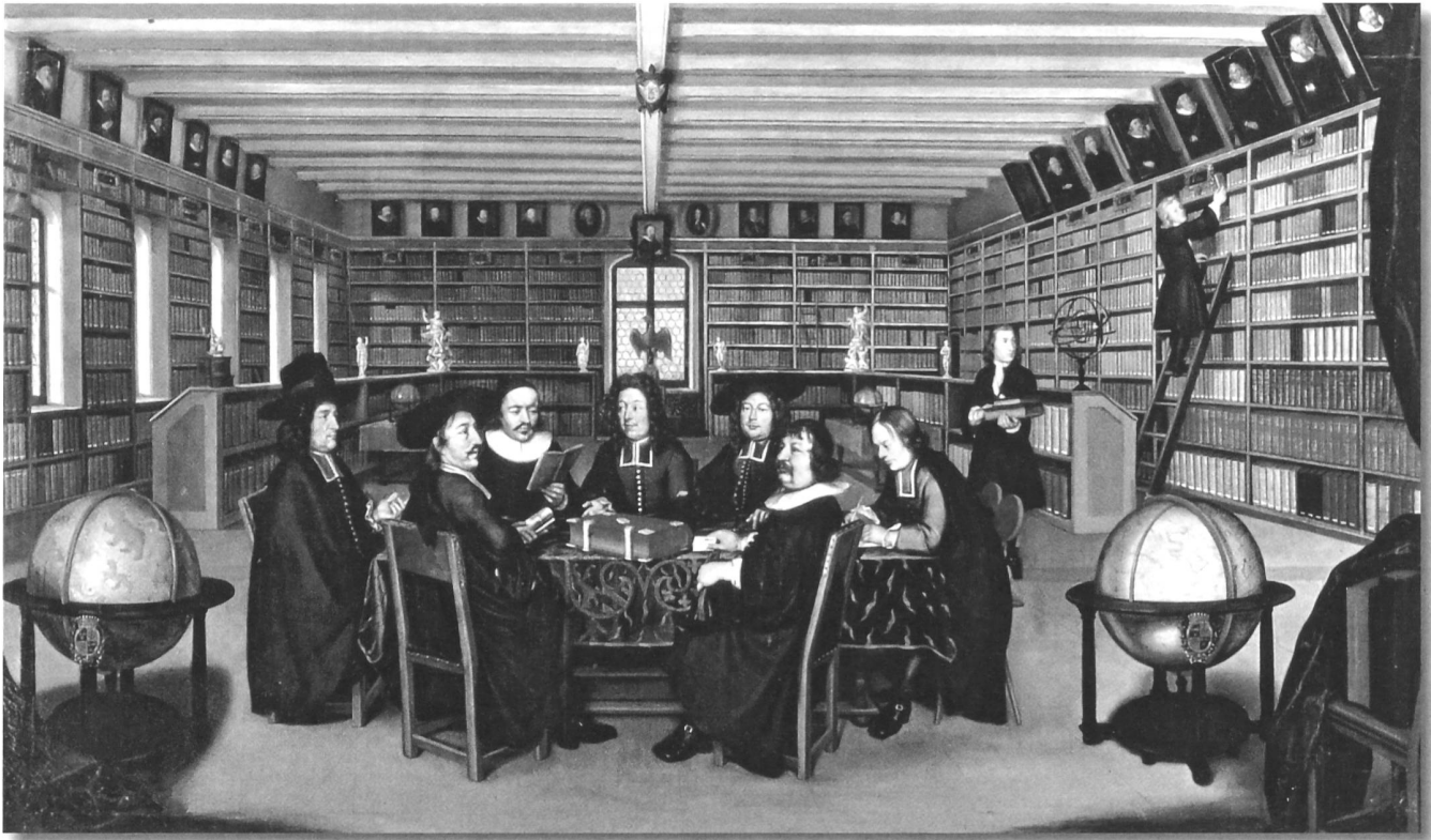
The Bernese library board in the new reading room, attributed to Johannes Dünz, 1696/97.

Die Berner Bibliothekskommission im neuen Lesesaal, Johannes Dünz zugeschrieben, 1696/97.