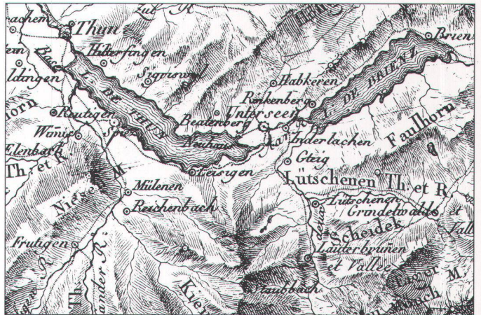
Ausschnitt aus der Schweizerkarte von J.H. Weiss, 1800