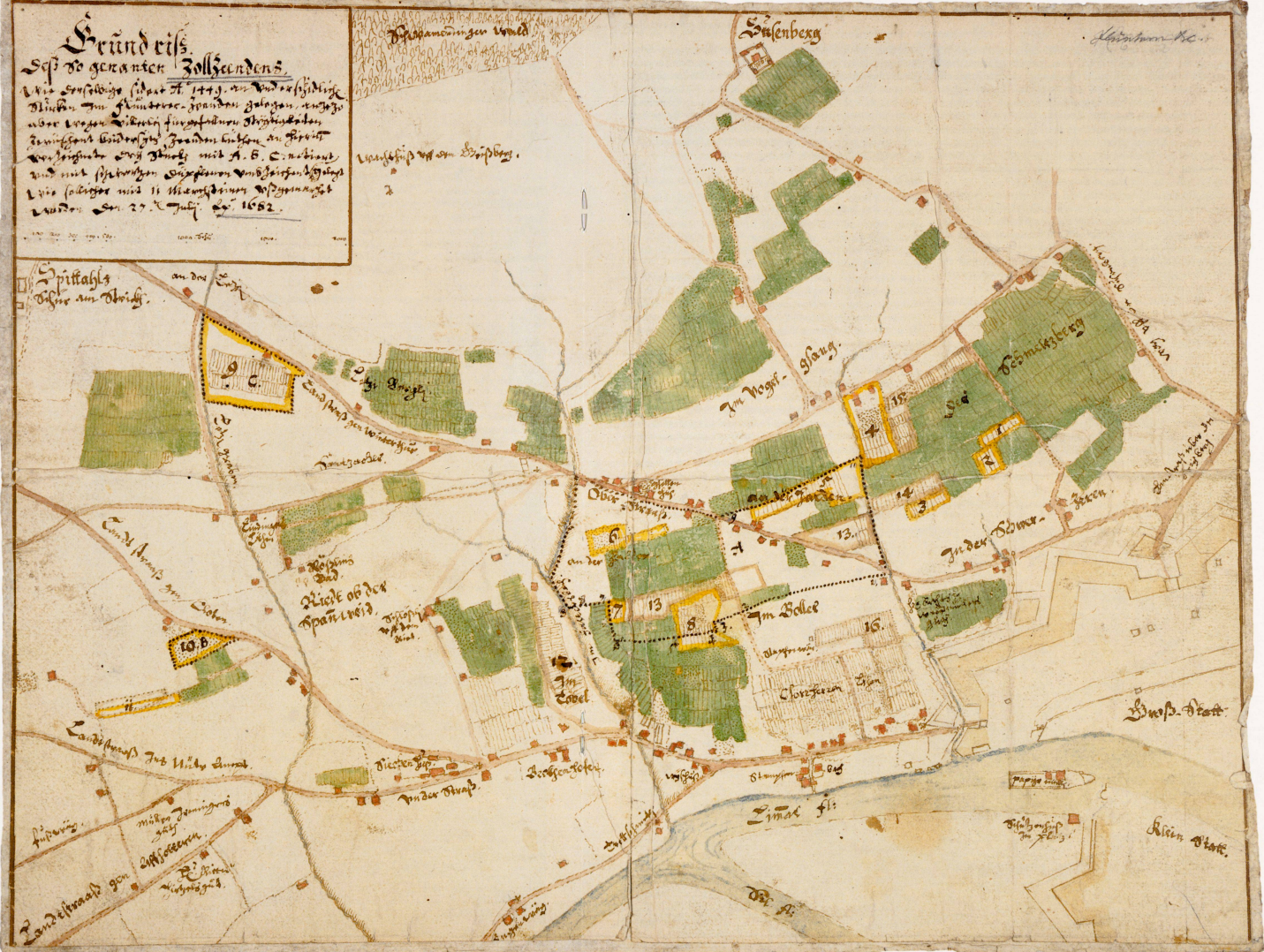
Abb. 5. «Grundriß des sogenannten Zoll- hausens, Plan des Almosenamtes vom 27. Juli 1682. Ca. 1:6250. Format 38,6 x 29,4 cm.

Grundriß Seit so genannten Zollhausens Wie ersichtlich ist aus H. 1743. in Vorderstättli Mitten im Kloster-Grund gelegen, welche aber wegen der alten Fundamente der Kirche demnach wiederholt zu bauen haben zu sein und mit der Kirche mit A. B. C. abgebaut und mit der Kirche zusammengeführt wie solches mit 11 Menschenen besetzt wurde am 27. Juli 1682.