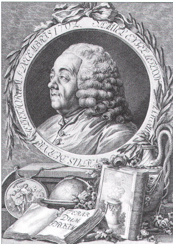
Samuel Engel (1702–1784), Berner Ökonom und Geograph. Kupferstich, 16 x 22,5 cm (Burgerbibliothek Bern, Neg. Nr. 2643).