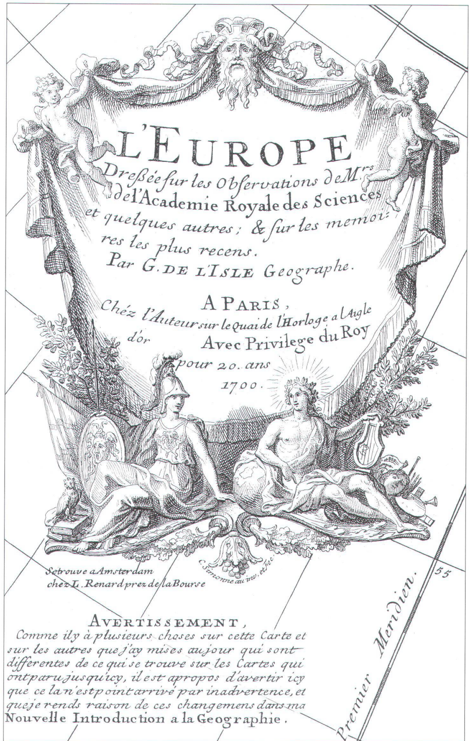
Abb. 2: Titeltartusche der Karte L'Europe von Guillaume Delisle, 1700. Interessant ist, dass sich damals der Kartenautor in einem Avertissement folgendermassen rechtfertigen musste: «Weil es auf dieser Karte und den anderen (Karten des Atlases) mehrere Dinge gibt, die ich nachgeführt habe und welche anders dargestellt sind als auf Karten, die bis anhin erschienen sind, ist es nötig, hiermit bekanntzugeben, dass dies nicht durch ein Missgeschick passiert ist und dass ich in meiner Nouvelle Introduction a la Geographie die Gründe zu diesen Änderungen aufzeige.» (Ryhiner-Sammlung, STUB Bern).