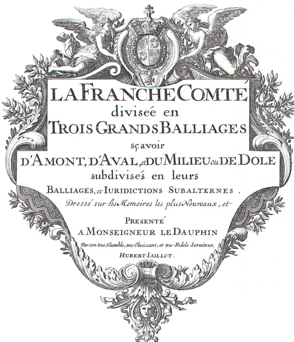
Abb. 1: Titeltartusche der Karte des französischen Juras La Franche Comté von Alexis-Hubert Jaillot (Ryhiner-Sammlung, StUB Bern).