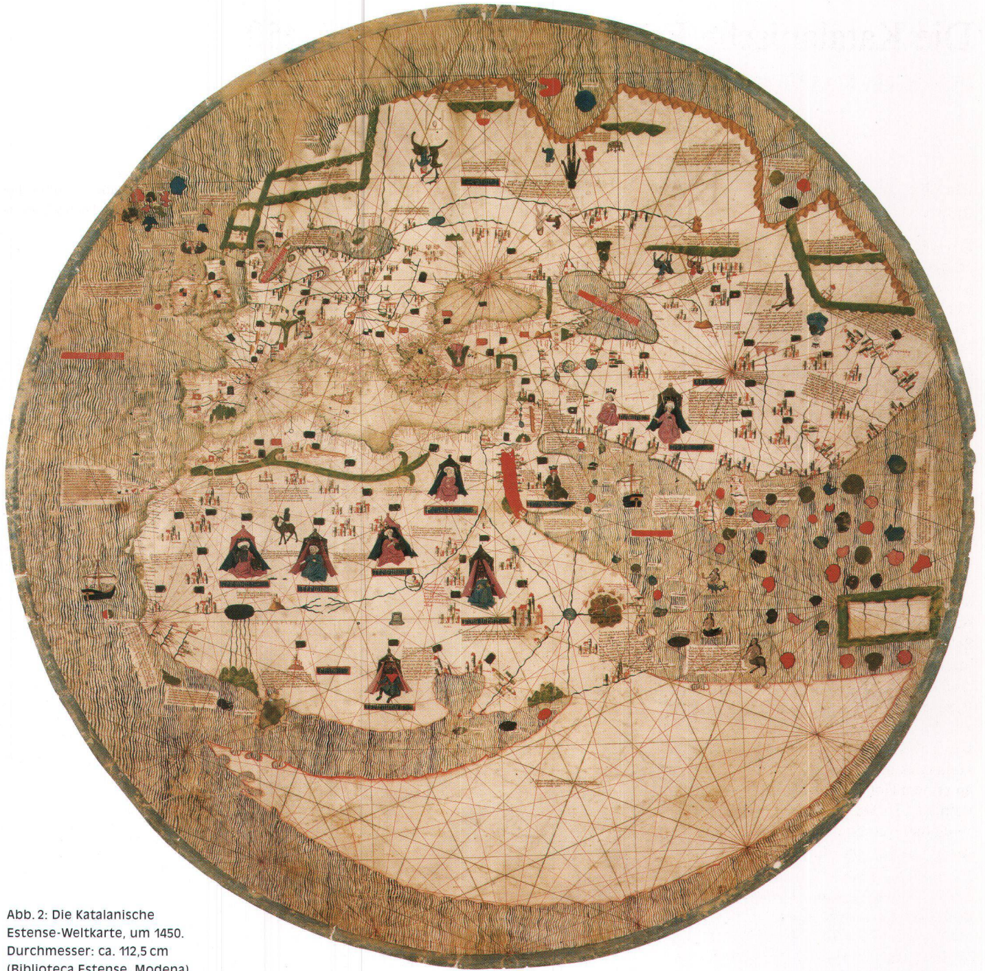
Abb. 2: Die Katalanische Estense-Weltkarte, um 1450. Durchmesser: ca. 112,5 cm (Biblioteca Estense, Modena).

Die ganze Karte stellt die klassische dreigeteilte Erde dar und ist – nach Art der Portolane – mit einem Rumbennetz von 16 Windstrichen überzogen, die von einer sechzehnstrahligen Windrose ausgehen, welche allerdings nicht im Zentrum der Karte steht, sondern etwa 15 cm nach Süden verschoben ist.