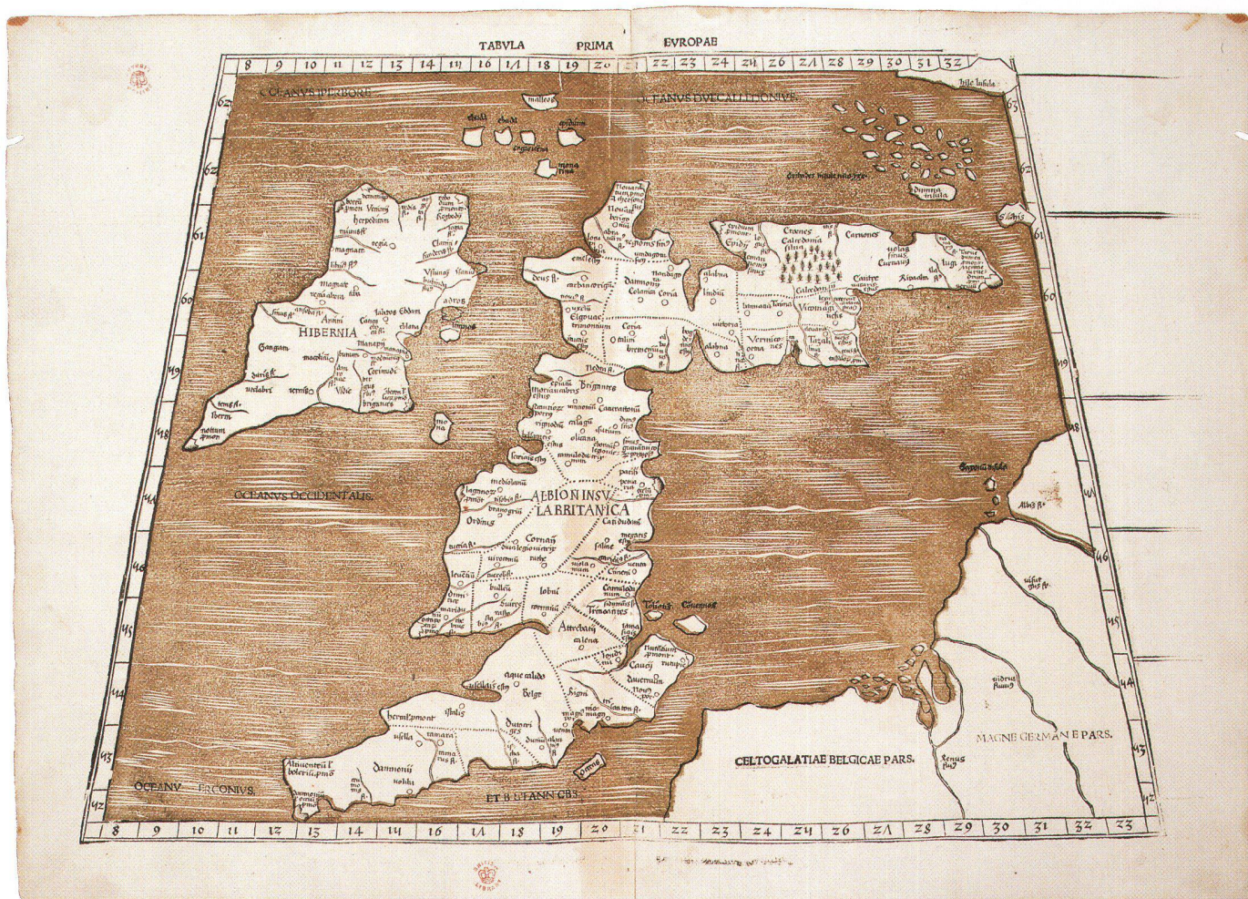
Abb. 1: Karte der Britischen Inseln aus dem Ptolemaeus-Atlas von Martin Waldseemüller (Strassburg, 1513 oder 1520). Holzschnitt, zweifarbig gedruckt, Format: 40,5 x 56,5 cm (London, British Library Map Library, unkatalogisiert).

1996 erwarb die Map Library der British Library eine Karte aus der Ptolemaeus-Ausgabe von 1513 des Martin Waldseemüller, die in einer zur damaligen Zeit unüblichen Weise farbig gedruckt worden ist. Bei diesem Beispiel eines offensichtlich experimentellen Farbdruckes handelt es sich um die Karte der Britischen Inseln, die in dieser Form bisher nicht bekannt war (Abb. 1).