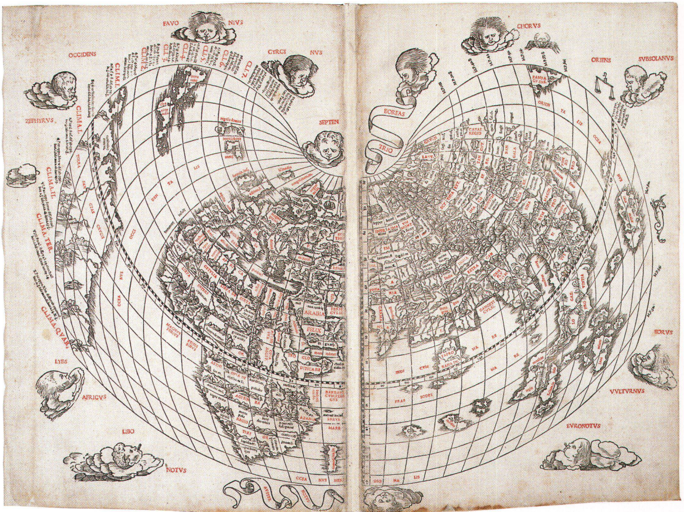
Abb. 7: Weltkarte mit Namen in roter Farbe aus dem Ptolemaeus-Atlas, herausgegeben von Bernardus Sylvanus (Venedig, 1511).