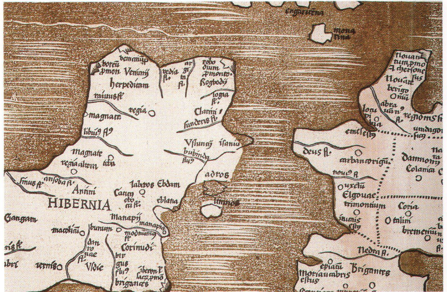
Abb. 4: Ausschnitt aus Abbildung 1. Die zweite, flächenhafte Farbe für den Meererton passt überraschend gut, mit Ausnahme der fehlerhaften Darstellung um die Insel adros und die Halbinsel isaniu[m] .

Das Fehlen von Text ausserhalb der rechteckigen Randlinie ist auch bei anderen Exemplaren der beiden Ausgaben festzustellen, sogar bei derjenigen von 1513, die normalerweise den Titel TABVLA PRIMA EVROPAE trägt. 9 In der Ausgabe von 1520 wurde auf Titel und weitere Randtexte, die jeweils mit Buchdrucklettern hinzugefügt waren, konsequent verzichtet. Erklären kann man dieses Weglassen mit dem zusätzlichen Aufwand des Schriftsatzes sowie möglicherweise mit der gebotenen Eile, die sich bei einem unerwarteten Nachdruck ergeben konnte. Als die Ausgabe von 1520 gedruckt wurde, war die Information ausserhalb des