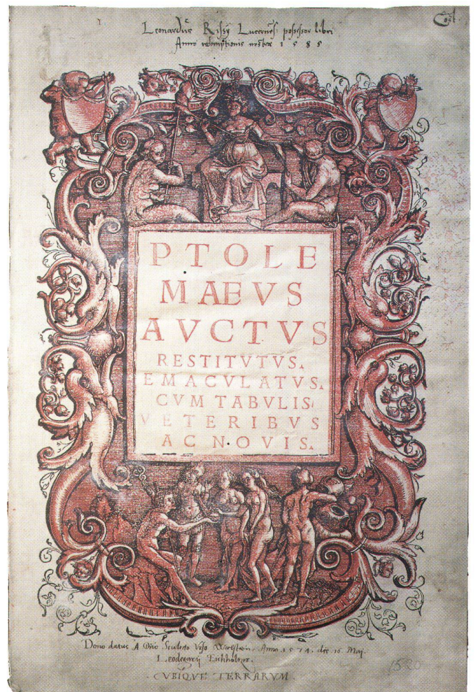
Abb. 6: Titelblatt des Ptolemaeus-Atlas von Martin Waldseemüller (Strassburg, 1520). Holzschnitt, zweifarbig gedruckt.

Karte der Britischen Inseln, wohl aus Kostengründen, auf die Herstellung weiterer Farbplatten verzichtet. Trotzdem ist es erstaunlich, dass offensichtlich während den folgenden 240 Jahren kein Kartograph oder Drucker versuchte, die Farbdrucktechnik weiter anzuwenden und zu verbessern. Abschliessend kann festgehalten werden, dass es sich beim Exemplar der British Library um ein sehr seltenes, bisher unbekanntes Beispiel eines Experimentes handelt, das sein Ziel nicht erreicht hat. Die Bezeichnung «Probedruck» ist zwar spekulativ, doch kann es als erwiesen gelten, dass die Karte in diesem Zustand noch nicht fertig war. Jedenfalls wurde das Blatt gedruckt, bevor die Meer- und Gebietsnamen in ihrer Schreibweise kontrolliert waren. Es wäre interessant zu wissen, ob weitere farbig gedruckte Karten von Waldseemüller existieren, die noch unerkannt in Bibliotheken oder anderen Institutionen schlummern.