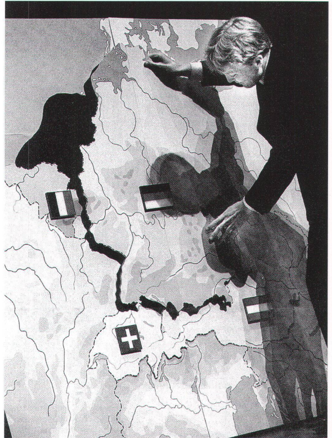
Kronprinz Willem-Alexander der Niederlande eröffnet den Kartographie-Kongress.

Der Arbeitskreis der Kartenkuratoren innerhalb der Deutschen Gesellschaft für Karto-