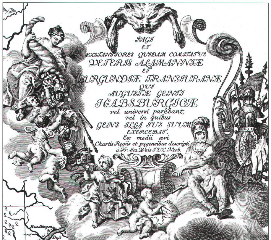
Die Titelkartusche der Alemannia-/Burgundkarte aus dem Werk Genealogia diplomatica .

auf urkundlichen Quellen beruhende Geschichtskarte, die das Gebiet Alemanniens und des jenseits des Jura – also in der Schweiz liegenden – Teils des mittelalterlichen Burgunds mit den damals gebräuchlichen Ortsnamen darstellt. Ihr Autor ist ein weiter nicht bekannter Franz Joseph Weisz, ein Freund der Rechtswissenschaft, vermutlich aus Neuburg an der Donau; in Kupfer gestochen wurde sie von Gottfried von