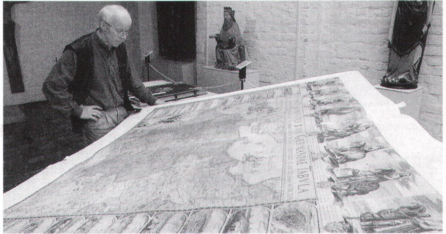
Die Deutschlandkarte im grossen Rostocker Atlas.