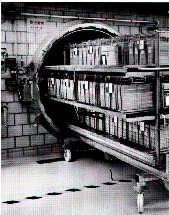
Die gefüllten Drahtkörbe vor der Behandlungskammer