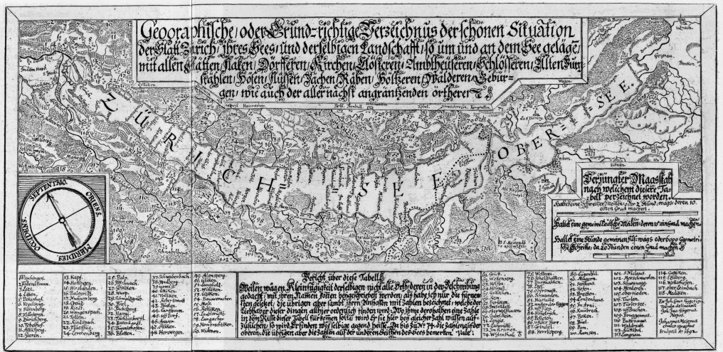
Karte des Zürich-See. Kupferstich von Hans Erhard Escher, 1692. 29,5 x 14,5 cm. Abbildung auf ca. 92% verkleinert.

Von 1621 bis zur ersten Stadtvereinigung 1893 Gezeichnetes und kommentiertes Stadtbild von Thomas Germann Baugeschichtliche Beiträge von Jürg E. Schneider Zürich: Werd Verlag, 2000, 92 Seiten 42,5 x 30 cm, ISBN 3-85932-322-9, geb., SFr. 98.00