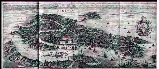
M. Merian, Itinerarium Italiae nov-antiquae. Frankfurt/Main 1640. Erlös November-Auktion 2002: € 8.200,-

Auf Wunsch übersenden wir Ihnen gern unsere illustrierten Kataloge.