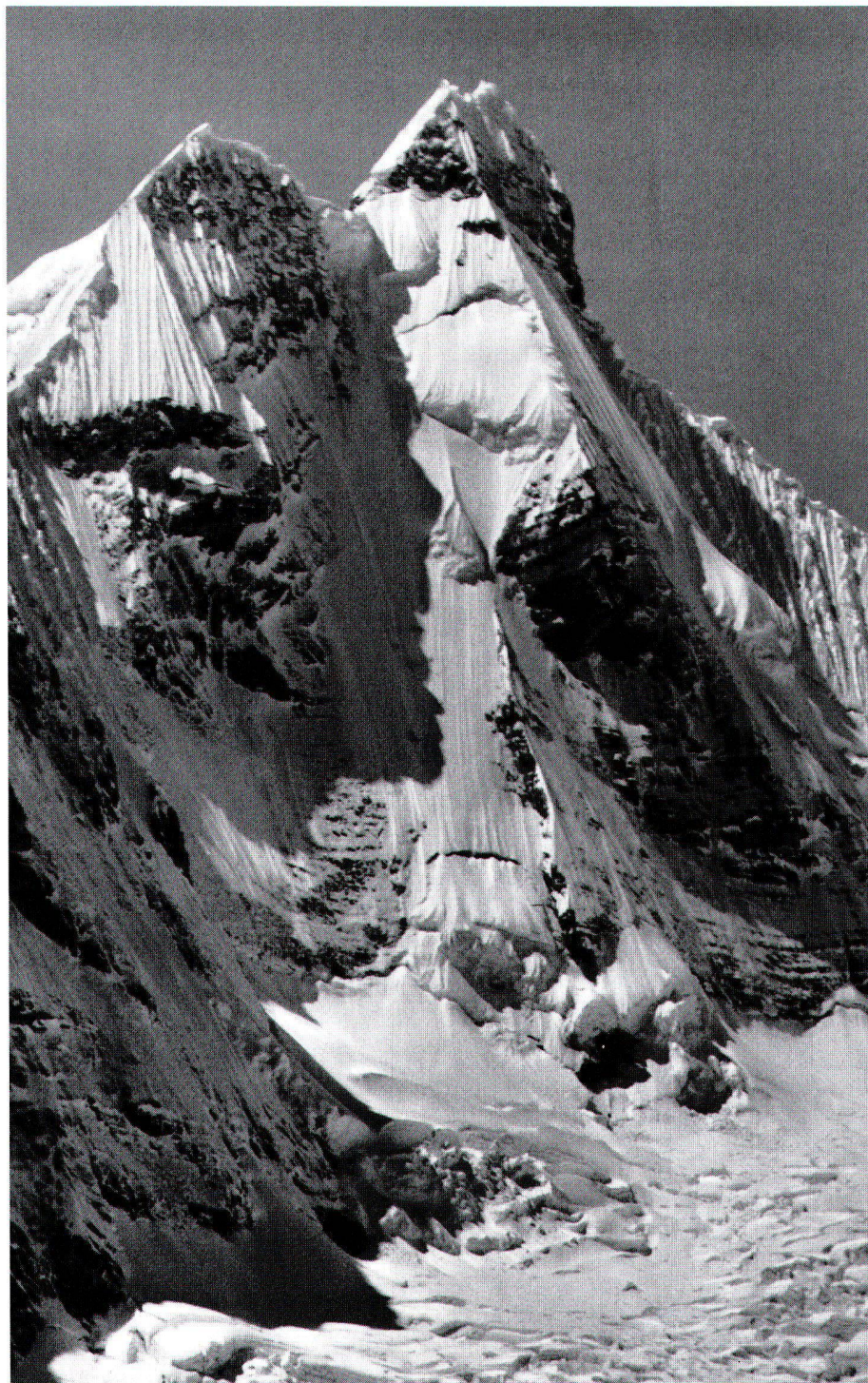
Abb. 7: Jirishanca (6126 m, Kordillere von Huayhuash), das «Matterhorn von Südamerika», 1957 von Mitgliedern des Österreichischen Alpenvereins ersterstiegen. In: Cordillera Huayhuash, Perú. Ein Bildwerk über ein tropisches Hochgebirge . Innsbruck 1955.

am 31. Mai 1970. In: Die Berg- und Gletscherstürze vom Huascarán, Cordillera Blanca, Peru . Innsbruck 1983 (= Hochgebirgsforschung , 6). S. 31–50, 13 Abb., 1 Kt.