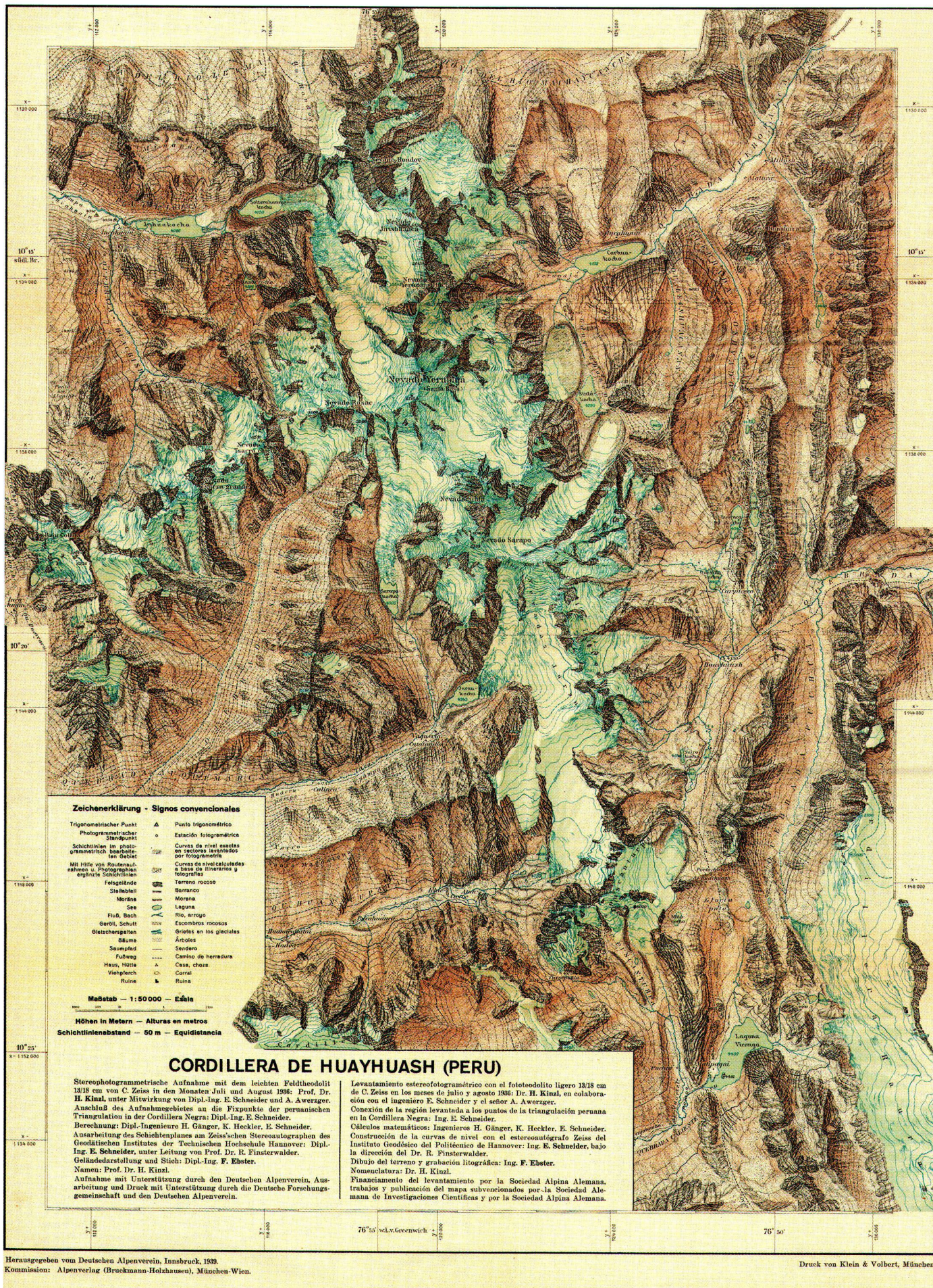
Abb. 2: Karte der Cordillera de Huayhuash (Peru), 1:50 000, 1939. Format 43 x 57 cm. Abb. auf 45 % verkleinert.