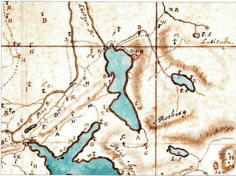
Abb. 3: Ausschnitt aus der Carte originale du Général Pfyffer , um 1770. Aquarellzeichnung, ca. 1:245000, nordorientiert. Die in der Karte abgekürzten Ortsnamen sind – hier nicht abgebildet – rechts neben dem Kartenbild in einer alphabetisch geordneten Liste vollständig aufgeführt. Abbildung 1:1 (Gletschergarten, Luzern).