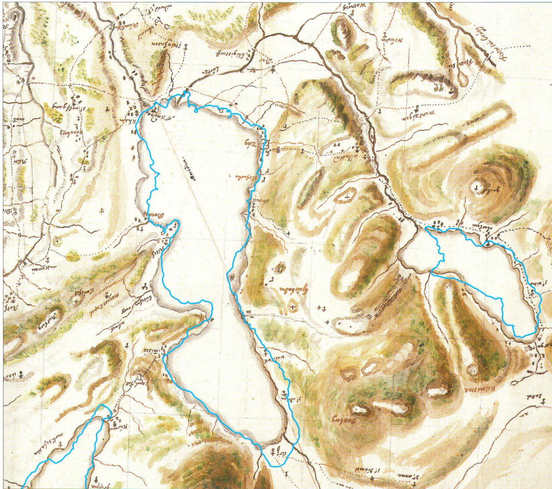
Abb. 4: Ausschnitt aus der in die Landeskoordinaten umgerechneten und nach Norden gedrehten Karte des Kantons Zug mit den überlagerten Konturen des Zuger- und Ägerisees aus der aktuellen Landeskarte. Man beachte den für Pfyffer typischen Darstellungsfehler am Nordwestende des Ägerisees (Entwurf: Jana Niederöst).

Es zeigte sich, dass vor allem die Geländeskizzen bezüglich Namensgebung recht ergiebig waren. Allerdings kamen nur Skizzen des Kantons Zug oder dessen Umgebung in Frage, insbesondere die Blätter 33 bis 48. 9 Für übergeordnete Begriffe wie «Rivière» oder «Reuss» konnten natürlich auch andere Geländeskizzen oder die Carte originale beigezogen werden. Das Fragment einer Manuskriptkarte Luzern bis ins Eigental konnte für diese Untersuchung nicht verwendet werden, denn es ist nicht beschriftet. Die gleichen Wörter wurden miteinander auf Schriftbild, Orthographie und weitere typische Eigenarten von Pfyffer verglichen (siehe nebenstehende Tabelle).