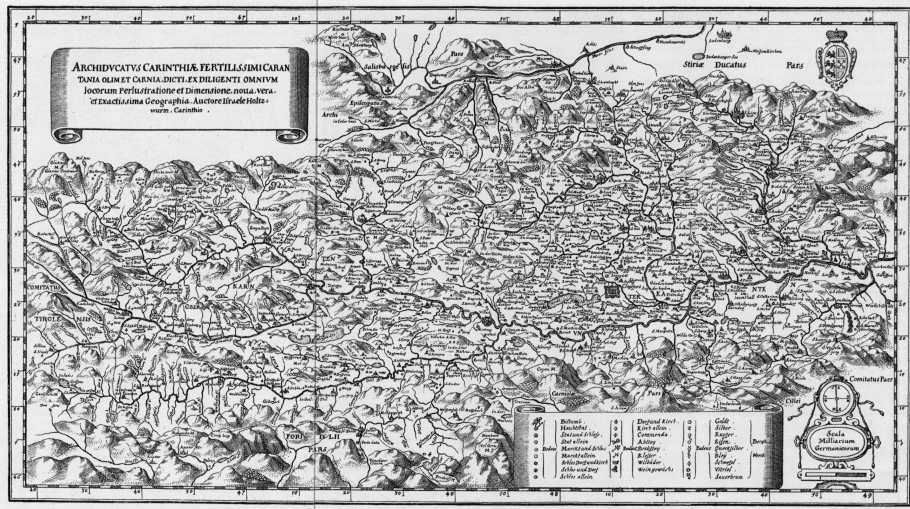
Abb. 3: Die verkleinerte Fassung von Matthäus Merian, 1616. Format: 37 x 20 cm (Merian Topographia Germaniae , Band Österreich, 1656, Faksimile-Ausgabe Bärenreiter-Verlag Kassel und Basel, 1963).