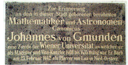
Gedenktafel Johannes von Gmunden am Rathaus in Gmunden am Traunsee