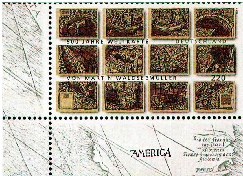
Sonderbriefmarke «500 Jahre Weltkarte von Martin Waldseemüller» (Deutschland E 2.20).

Die Exposition philatelique des motifs wird seit 1959 alljährlich im luxemburgischen Bad Mondorf organisiert. Der