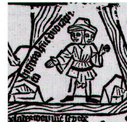
Abb. 1: Zweiköpfiger Mann mit erklärender Beischrift hi ge[n]t[el]s h[abe]nt duo capit . Ausschnitt aus dem Fragment einer Weltkarte (vgl. Abb. 2).

Der erhaltene Stock ist in erstaunlich gutem Zustand (Abb. 3). Nur an der oberen Kante finden sich grössere Ausbrüche, die das Druckbild beeinträchtigen. Die vielen kleinen, von Rissen im Holz herrührenden Unterbrechungen der gedruckten Linien sind hingegen nicht auf mechanische Einflüsse von aussen zurückzuführen. Diese Schwundrisse rühren von der Reaktion des Holzes auf wechselnde klimatische Bedingungen her. Nimmt man nur die Qualität des erhaltenen Stocks als Massstab, so wurde die Karte nicht bis zur völligen Abnutzung der Stöcke gedruckt. Allerdings lässt sich daraus nicht einfach ein mit der Zeit erfolgtes gesunkenes Interesse an der Abbildung ableiten, da ebenso andere Stöcke der Karte in stärkere Mitleidenschaft gezogen worden sein könnten.