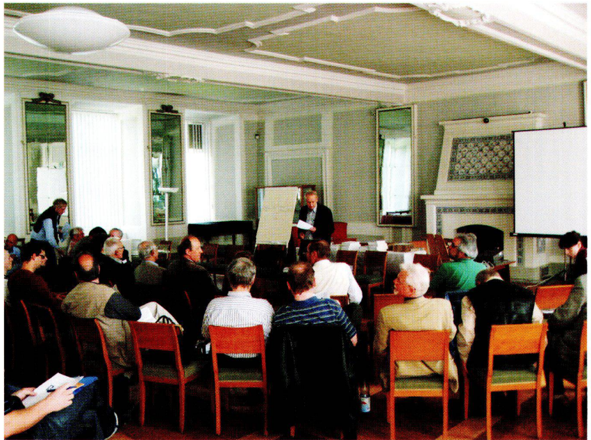
Abb. 1: Der Spiegelsaal im Schloss Friedenstein bot den Atlas-Tagen ein höfisches Flair.

Freudig aufgenommen wurde im Kreise der Teilnehmer auch das Erscheinen von Petermann's Planet – Vol. II: The Rare and Small Handatlases including Globes als Ergebnis der bisher 12-jährigen Forschungstätigkeit von Jürgen Espenhorst. In diesem Rahmen stellten er und Erhard Kümpel auch erste Überlegungen zu einer weiteren Systematik deutscher Atlanten zur Diskussion. Da es zu einer weiteren Erforschung der deutschen Atlasproduktion eine Fülle von Material zu bewältigen gilt, wurde vorgeschlagen, das Konzept der «Atlasfamilien» als oberste Systematik um eine regionale Gliederung zu ergänzen. Da damit aber ein Einzelner überfordert ist, sollten sich