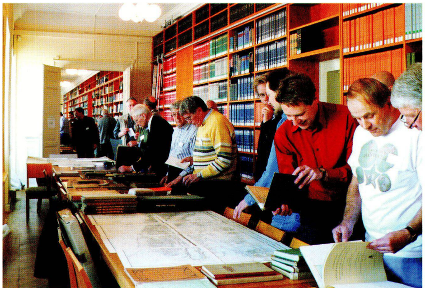
Abb. 2: Experten und Sammler hatten bei der Bücherbörse reichlich Gelegenheit zum Fachsimpeln.

möglichst viele an diesen Recherchen beteiligen. Um das zu ermöglichen, muss ein Erfassungs- und Auswertungskonzept entwickelt werden. Joachim Neumann wird Überlegungen dazu auf dem Kartographiegeschichtlichen Colloquium Anfang November in Hamburg vortragen. Bei einem Spaziergang anhand des Stadtplanes von Gotha, publiziert auf dem Stieler-Titelblatt, wurden noch einmal die Erinnerungen an die Residenzstadt aus dem 19. Jahrhundert geweckt und auf historischen Pfaden gewandelt. Der kurze Rundgang endete mit einer Besichtigung der Räumlichkeiten des Justus Perthes Verlages, in denen bis 1992 noch