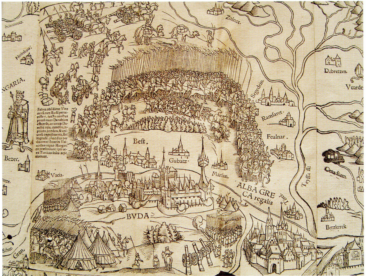
Abb. 10: Der ungarische Raum in der Haselberg-Karte.

ment inclus la sphère d'influence historique de la Russie à la Méditerranée orientale avec Jérusalem. Un livret annexé, intitulé Des Türkischen Kayzers Heerzug , explique les événements de l'année 1529 et l'état d'esprit contemporain dans l'Europe centrale chrétienne avec l'appel à une nouvelle croisade.