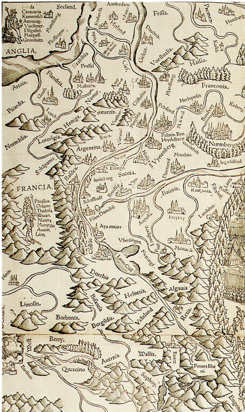
Abb. 7: Das Rheingebiet in der Haselberg-Karte.

wie das Bild von Donaumündung und der Krim stammen eindeutig aus der nur in Fragmenten bekannten vierblättrigen Wandkarte des südlichen Osteuropa, die der polnische Kartograph Bernard Wapowski (1475–1535) kurz nach 1526 in Krakau publiziert hat. 45