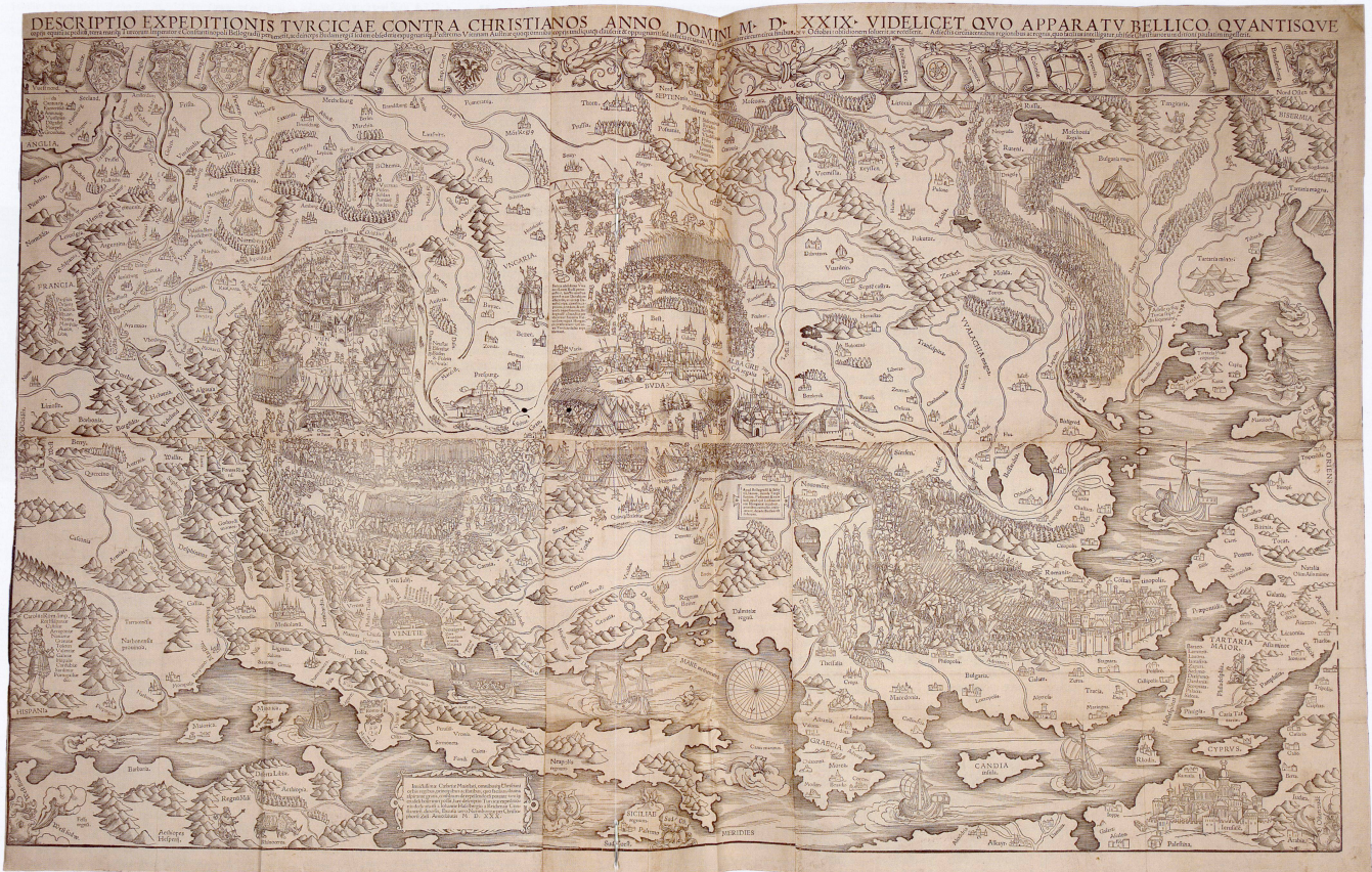
Abb. 2: Die Wandkarte des Türkenzuges 1529 von Johann Haselberg in der Schlossbibliothek von Holkham Hall. Format: 98,5 x 62 cm.

niederungen des Balkans. Das Wetter war in diesen Wochen regnerisch, und so blieb ein grosser Teil der schweren Geschütze im Morast stecken. Am 6. August erreichte die osmanische Armee über Belgrad Osijek an der Draumündung. Am 18. August vereinigte sie sich bei Mohács mit Hilfstruppen Zapolyas. Am 8. September wurde die zwischenzeitlich an Habsburg übergegangene Festung Buda blutig zurückeroberd. Vielleicht erst in dieser Phase des Feldzuges